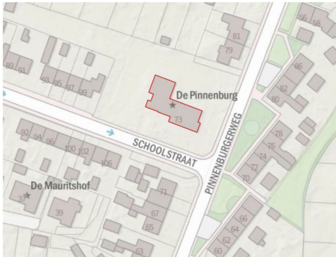
Figuur 1. Ligging en begrenzing te slopen bebouwing aan de Pinnenburg 73 te Putten.