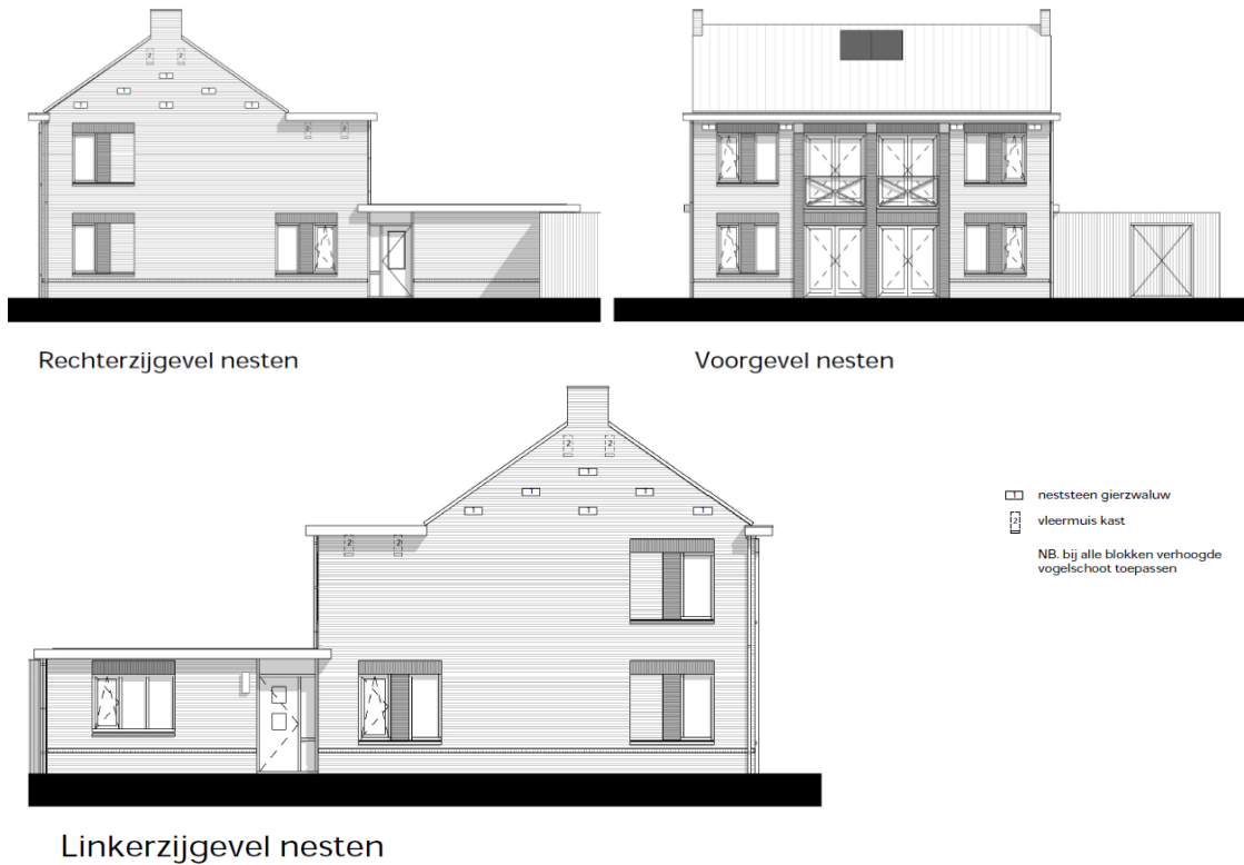
Figuur 4. Detailtekeningen met locaties permanente voorzieningen gierzwaluw en gewone dwergvleermuis in de gevels van de nieuwbouw.