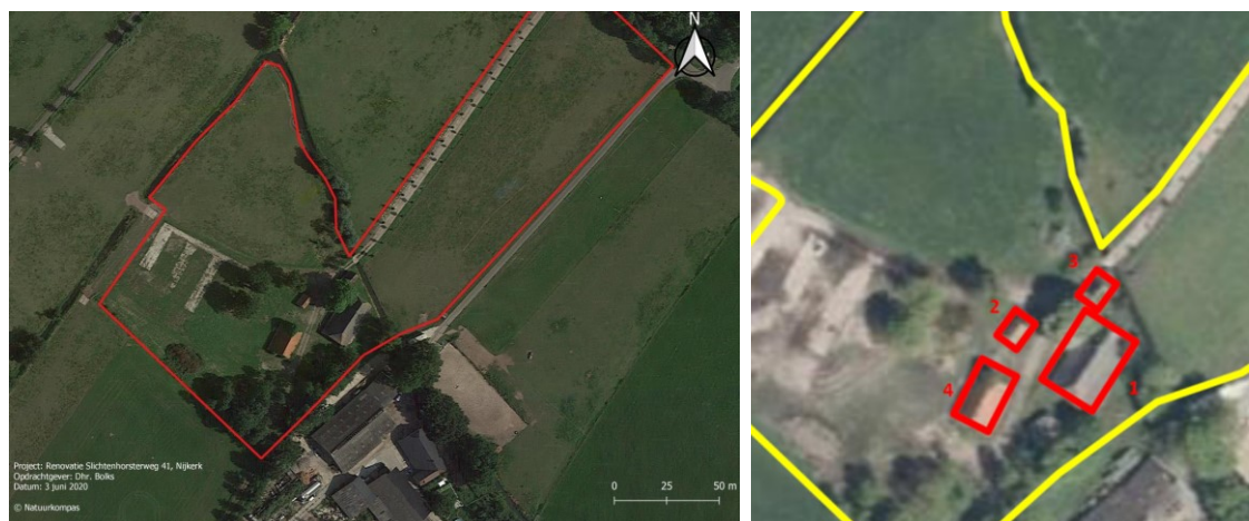
Figuur 2. Plangebied in rood en te slopen/herbouwen opstallen in rood.