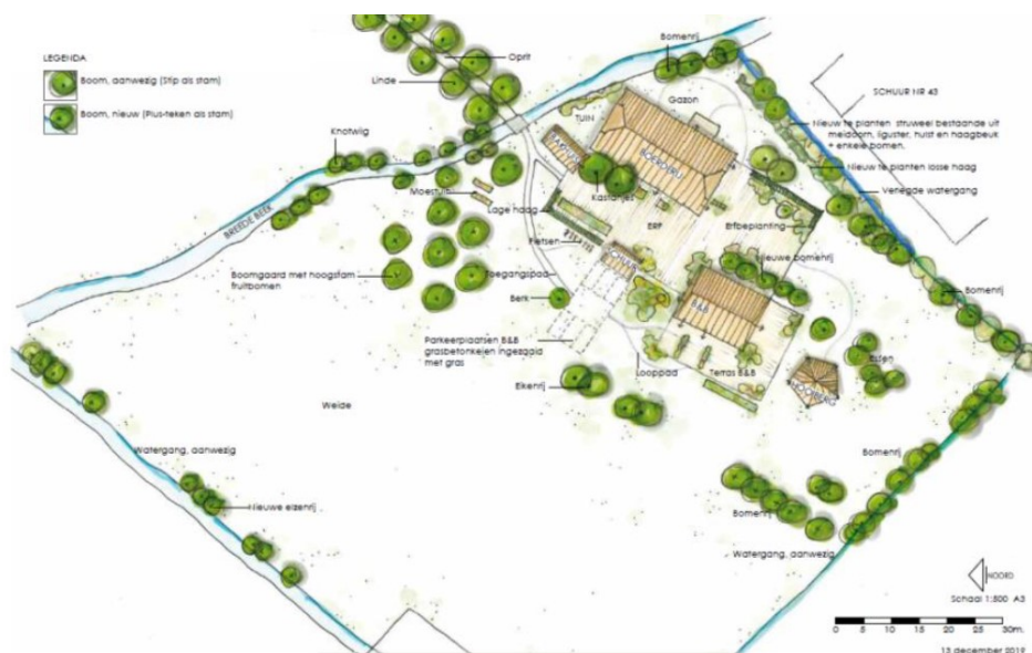
Figuur 3. Impressie van de toekomstig inrichting