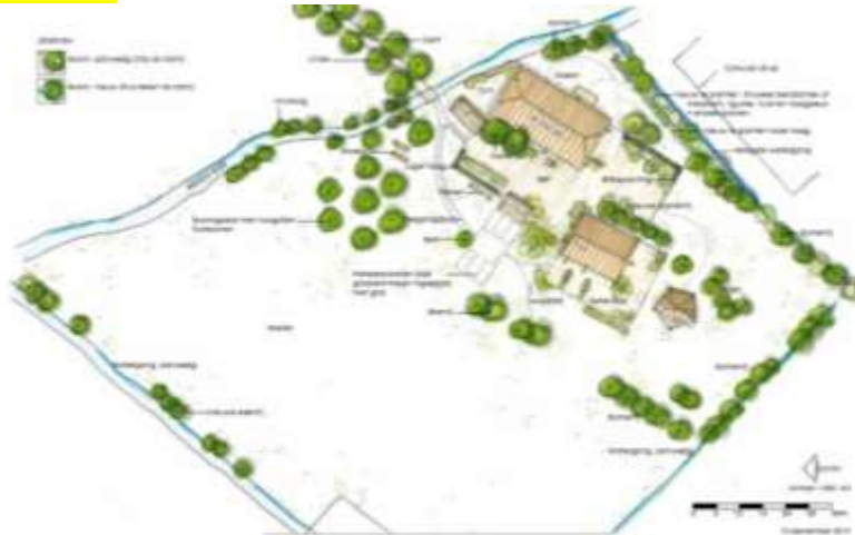
Figuur 3. Impressie van de toekomstig inrichting