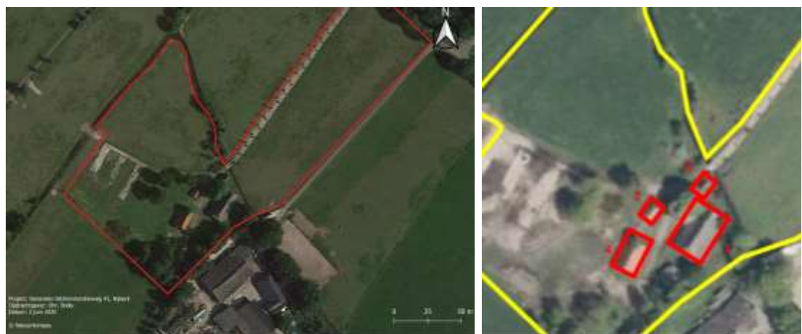
Figuur 2. Plangebied in rood en te slopen/herbouwen opstallen in rood.