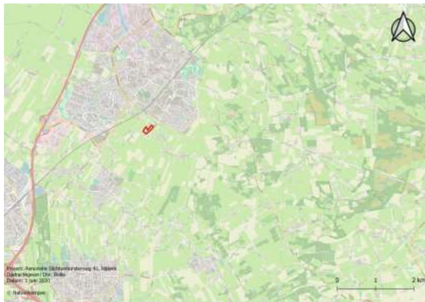
Figuur 1. Globale ligging van het plangebied met de plangrens in rood