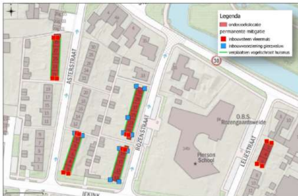
Figuur 4. Overzicht permanente maatregelen