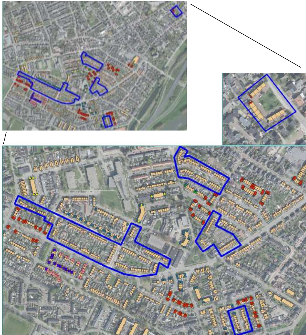
Figuur 1 Plangebied (blauw omkaderd).