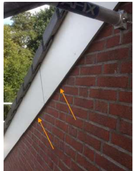
Figuur 4 Potentiële invliegopeningen onder gevelpannen voor gierzwaluwen en vleermuizen (l) en potentiële invliegopeningen onder boeiboord voor vleermuizen (r).