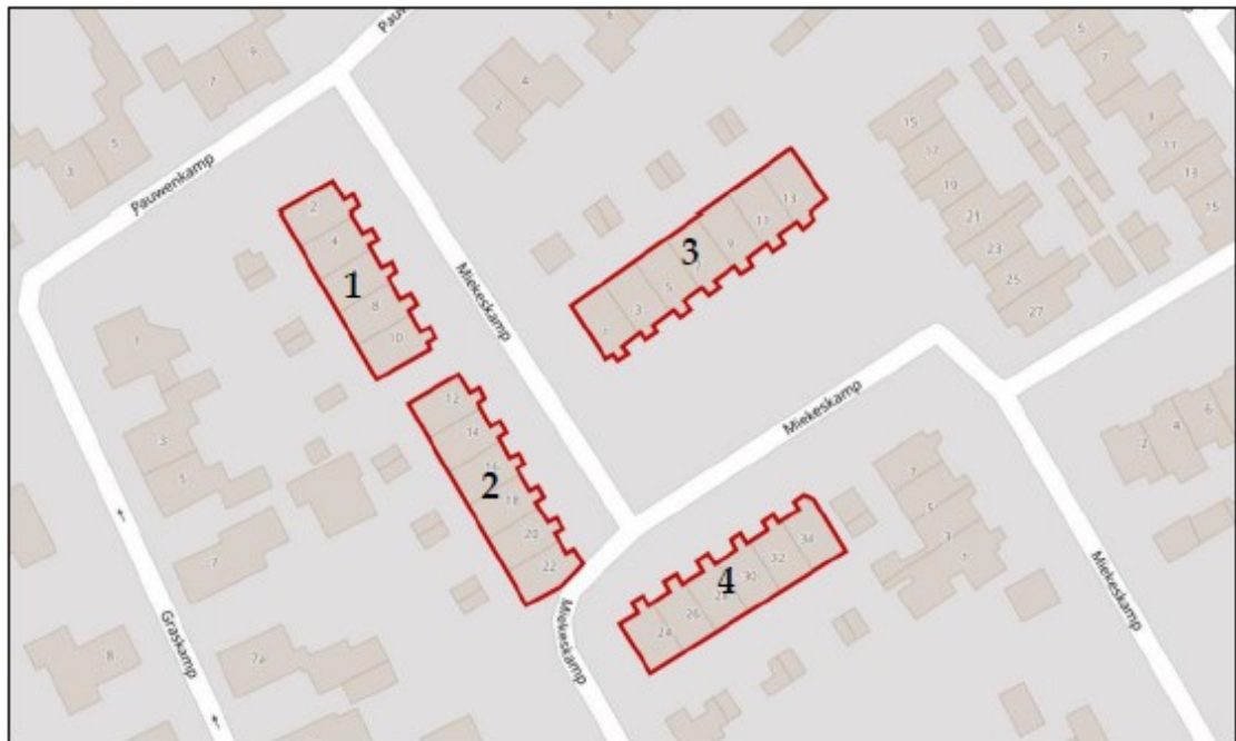
Figuur 1. Ligging en begrenzing projectlocatie Miekeshamp 1-13 (oneven) en 2-34 (even).