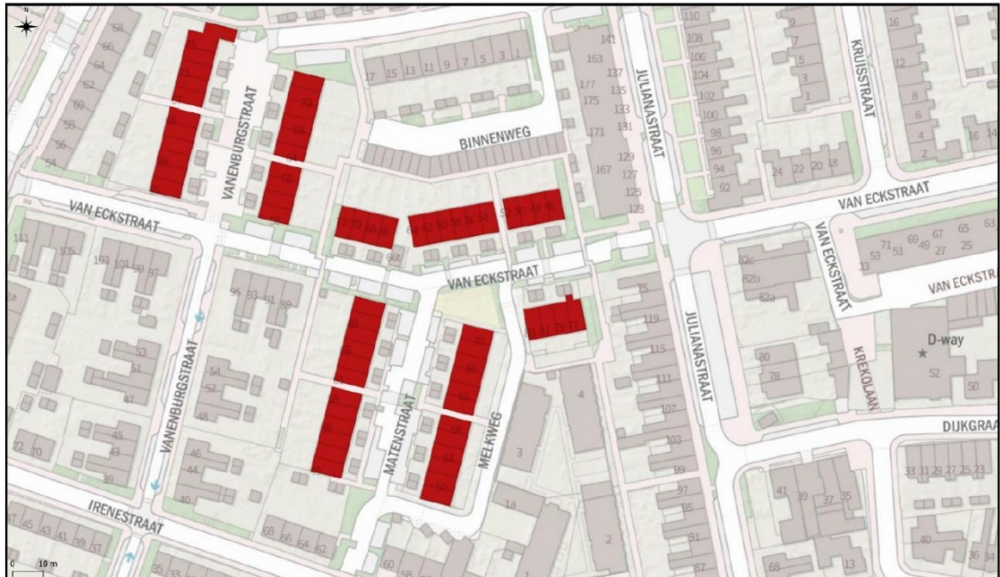
Figuur 1. Ligging en overzicht van de te renoveren woningen: Matenstraat 48 t/m 70 & 49 t/m 71, Van Eckstraat 46 t/m 72 & 77 t/m 83 en Vanenburgstraat 55 t/m 75 & 56 t/m 74 te Wageningen.