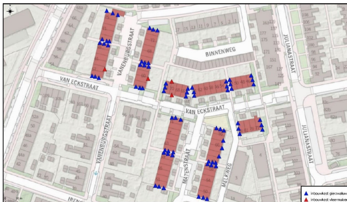
Figuur 3. Locaties permanente voorzieningen voor gierzwaluw (blauwe driehoekjes) in de te renoveren woningen (rode vlakken). Ondanks dat er geen verblijfplaatsen van vleermuizen zijn vastgesteld, worden er in de te renoveren woningen vier inbouwkasten voor vleermuizen geplaatst (rode driehoekjes).