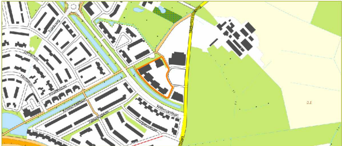
Figuur 1. Ligging en begrenzing projectlocatie Nederwoudseweg 23 te Barneveld (oranje kader).