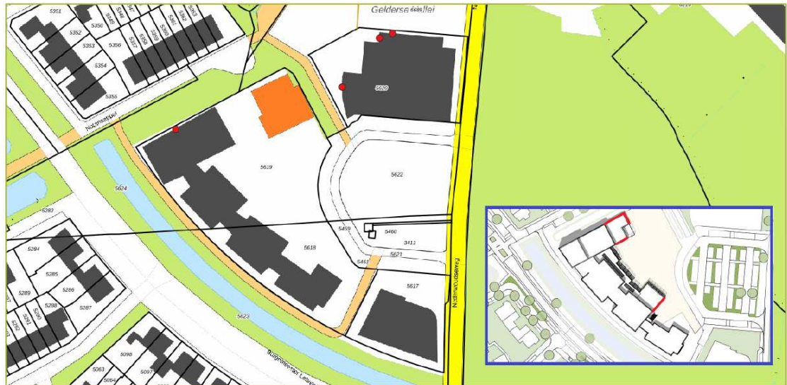
Figuur 3. Tijdelijke mitigatie in de vorm vier houten vleermuiskasten type Rosita van Faunus Nature Creations (rode stippen) ten opzichte van de te slopen bebouwing in het plangebied (oranje vlak). De locaties van de permanente voorzieningen zijn aangegeven in de inzet (rode vlakken).