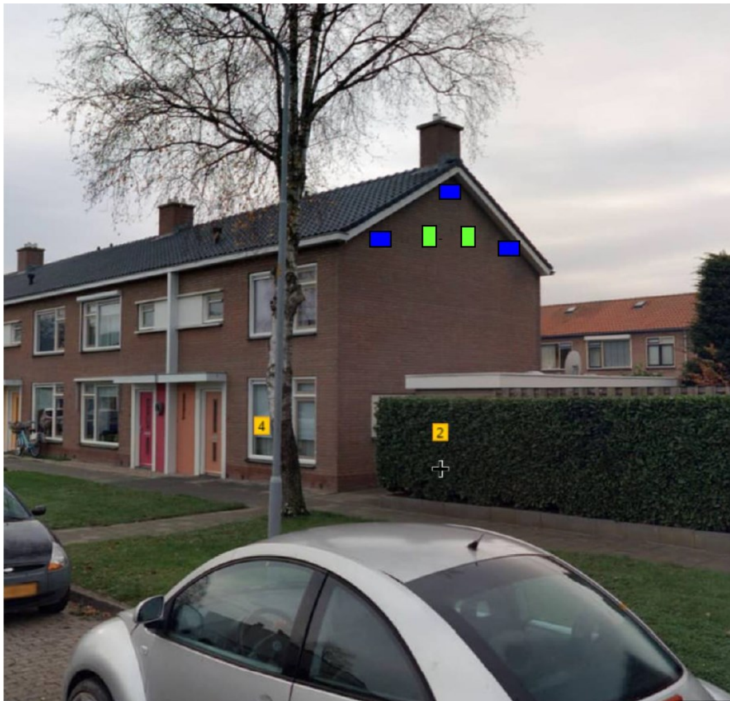
Figuur 2: locaties tijdelijke kasten aan Rembrandtstraat 2. In blauw de locaties van de gierzwaluwkasten en in groen de vleermuiskasten (Slemmer, 2022)