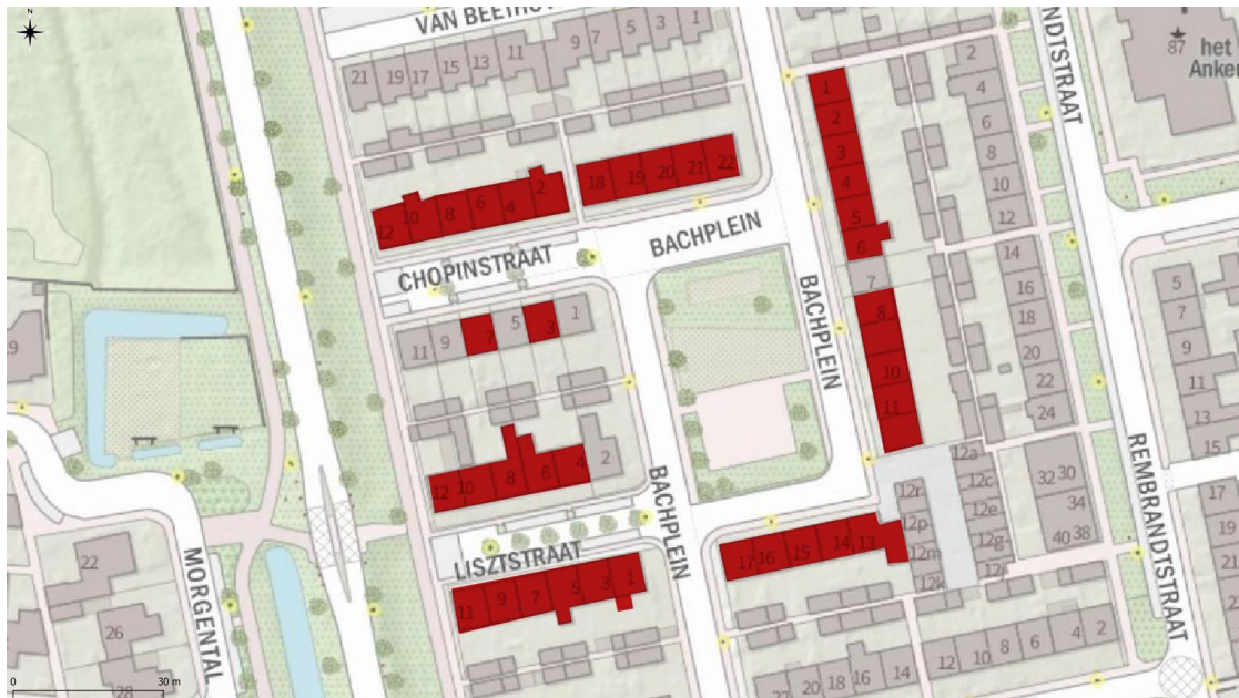
Figuur 1: Plangebied aangegeven in rood. Niet alle woningen zijn in bezit van Bazalt Wonen (Slemmer, 2021)