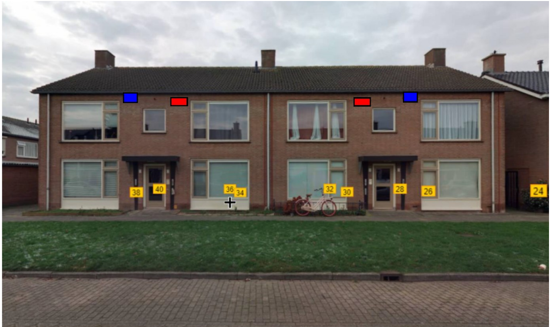
Figuur 3: locaties tijdelijke kasten aan de Rembrandtstraat 26 t/m 40. In rood de huismuskasten en in blauw de gierzwaluwkasten (Slemmer, 2022)