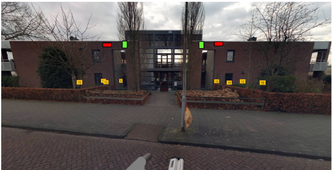
Figuur 4: locaties tijdelijke kasten aan het Mondriaanplein. In rood de huismuskasten en in groen de vleermuiskasten (Slemmer, 2022)