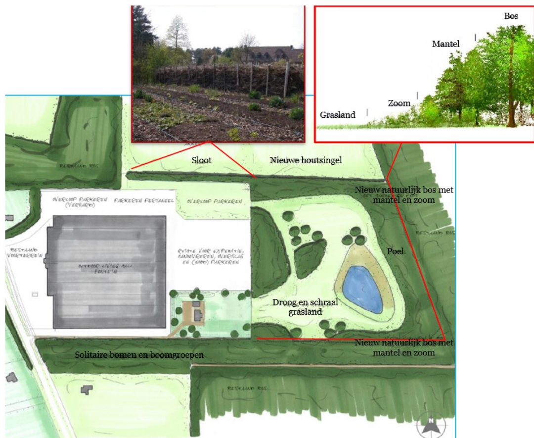
Figuur 3 Inrichting natuurgebied met onder andere een poel, een nieuwe houtsingel, droog en schraal grasland, bomen en bos.