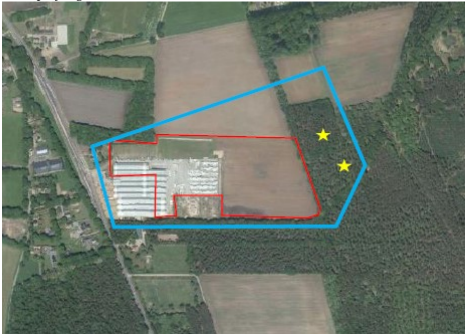
Figuur 1 Begrenzing plangebied (rood omlijnd) met locaties van de dassen(bij)burchten (sterren).