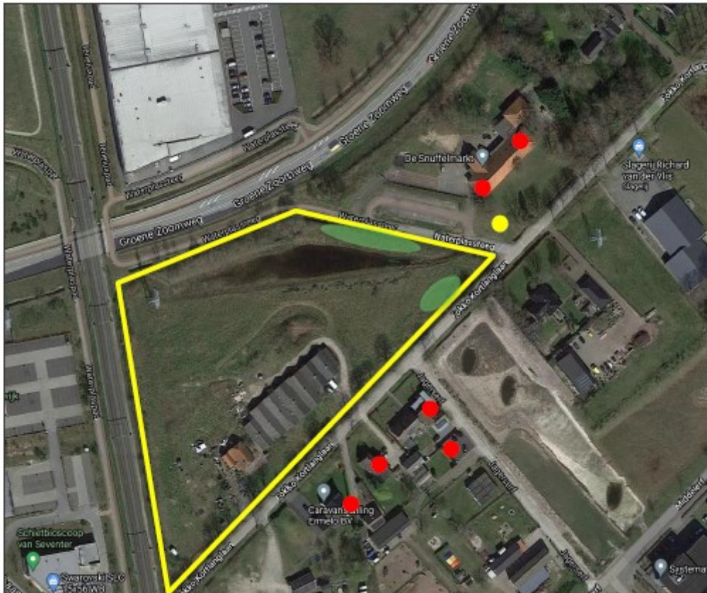
Figuur 1. Overzicht van de tijdelijke mitigatie voor de huismus met de locatie van de mussentil (gele stip) en de indicatieve locaties voor de losse nestkasten (rode stippen). De permanente voorzieningen worden in de nieuwbouw binnen het projectgebied gerealiseerd. De exacte locaties hiervan en het ontwerp worden bepaald in overleg met de ecologisch deskundige.