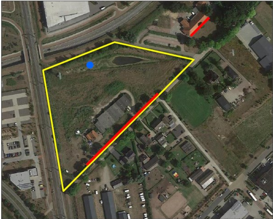
Figuur 3. Overzicht van de tijdelijke mitigatie voor de gewone dwergvleermuis met de locatie van de paalkast (blauwe stip) en het zoekgebied voor de platte kasten (rode lijnen). De permanente voorzieningen worden in de nieuwbouw binnen het projectgebied gerealiseerd. De exacte locaties hiervan en het ontwerp worden bepaald in overleg met de ecologisch deskundige.