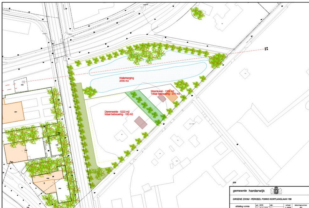
Figuur 3: Het projectgebied na de herinrichting.