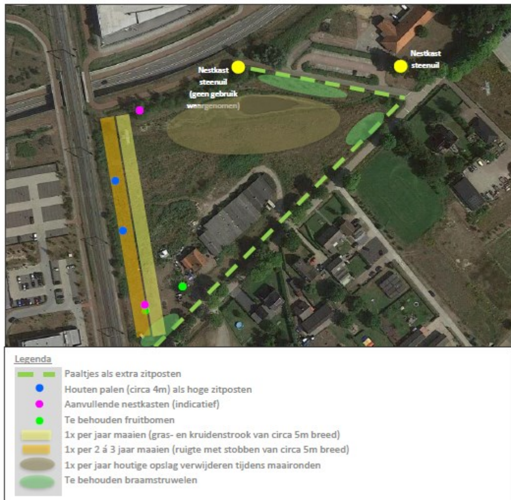
Figuur 2. Overzicht van de permanente mitigatie voor de steenuil met de te realiseren alternatieve voorzieningen en de maatregelen die worden genomen ten behoeve van het behouden en optimaliseren van het foerageergebied.