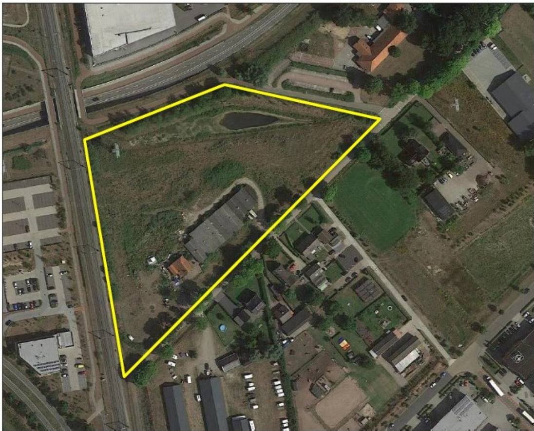
Figuur 2. Luchtfoto projectgebied (gele omtrek). Het gebied bestaat momenteel voornamelijk uit een ruige gras-/kruidenvegetatie. Aan de noordzijde bevindt zich een waterberging en aan de zuidgrens bevindt zich de woning van Fokko Kortlanglaan 169 met ten oosten daarvan een schurencomplex.