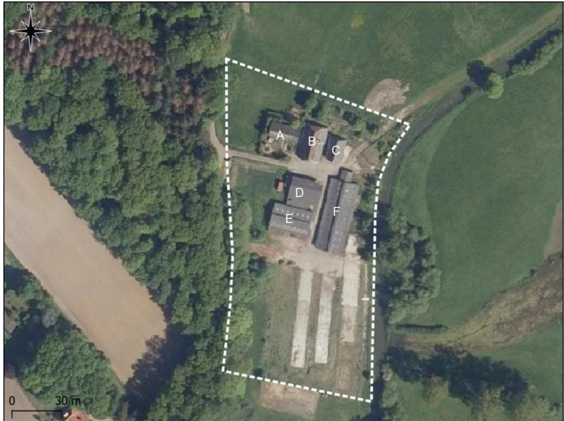
Figuur 2. Begrenzing projectlocatie en overzicht van de bebouwing: A. Bungalow, B. Boerderij, C. Schuur, D. Werktuigenberging, E. Jongveestal, F. Ligboxenstal. Gebouw B en C worden gerenoveerd, de overige bebouwing wordt gesloopt.