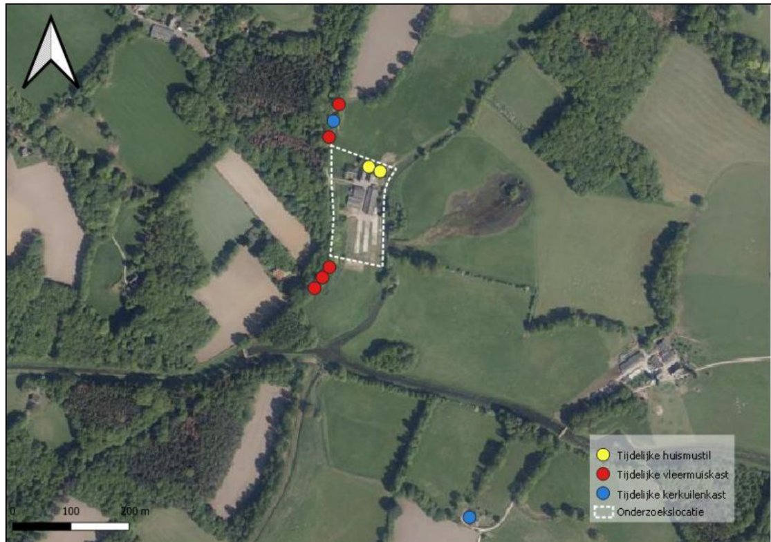
Figuur 4. Locaties tijdelijke voorzieningen huismus, kerkuil en gewone dwergvleermuis ten opzichte van de projectlocatie.