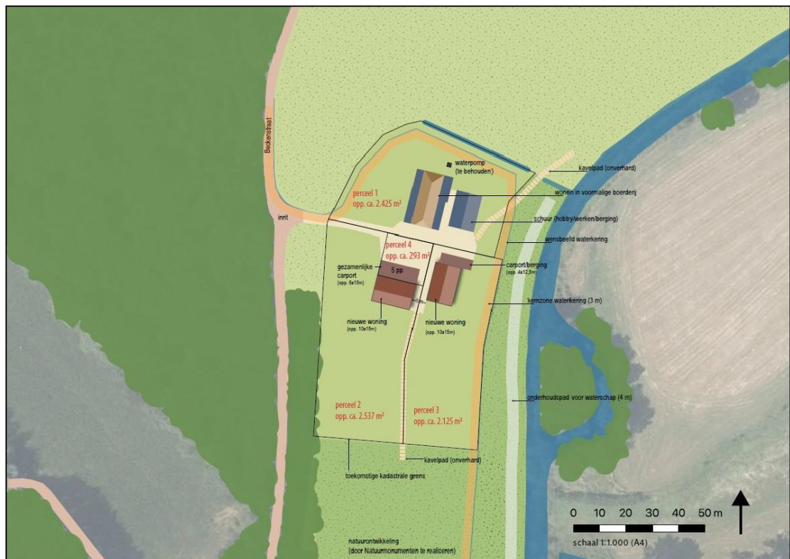
Figuur 3. Toekomstige situatie.