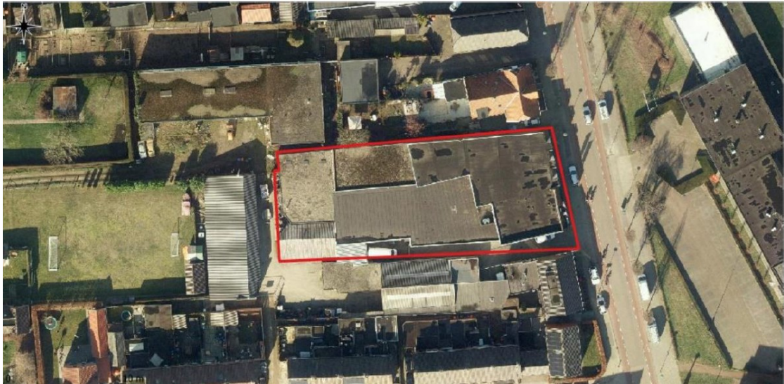
Figuur 1. Begrenzing projectlocatie aan de Frank Daamenstraat 23 te Ulft.