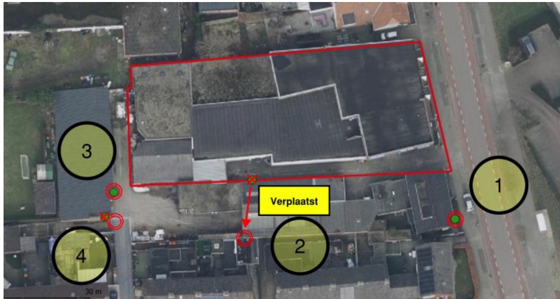
Figuur 2. Locatie van vier van de tijdelijke voorzieningen (rode cirkels) ten opzichte van het plangebied (rode kader). Deze voorzieningen zijn opgehangen op 22 januari 2022; kast 2 is op 29 januari verplaatst, omdat deze te laag was opgehangen.