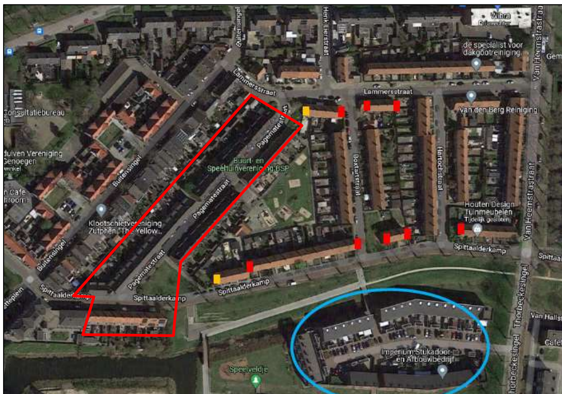
Figuur 2. De locaties van de tijdelijke voorzieningen voor huismuis (geel) en gewone dwergvleermuis (rood en blauwe cirkel). Voor huismuis betreft dit in totaal 6 kasten van het type NK MU o8 van Vivara Pro (of soortgelijk). Deze kasten worden in twee setjes van 3 geplaatst. Voor gewone dwergvleermuis betreft dit in totaal 32 kasten van het type VK WS o2 van Vivara Pro (of soortgelijk). Per rood vierkant zijn twee kasten geplaatst (8x2). Binnen de blauwe cirkel hangen eveneens 16 tijdelijke kasten, die voor een reeds eerder verleende ontheffing (zaaknr: 2020-013323) gebruikt zijn. Het plangebied is rood omlijnd weergegeven.