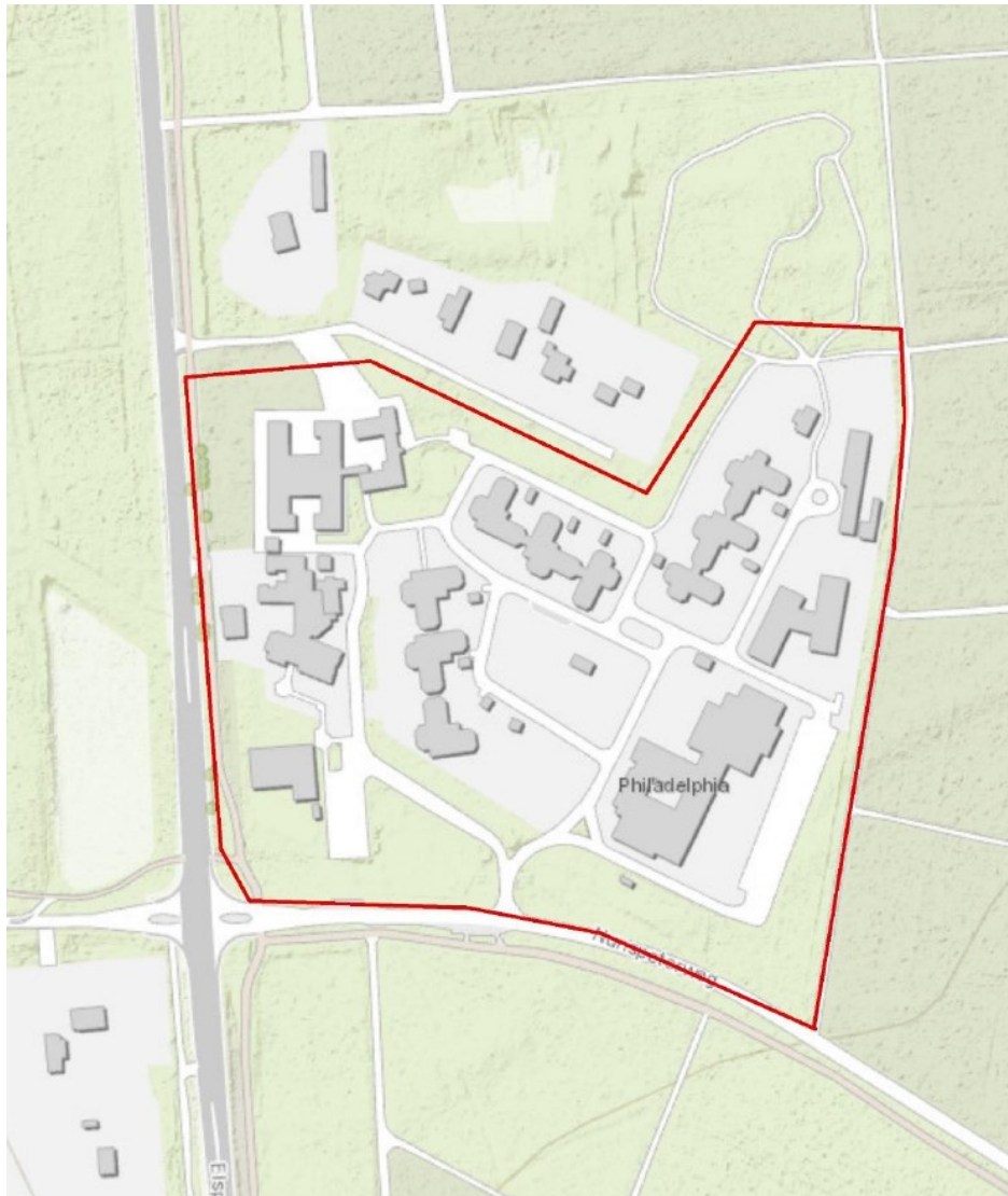
Figuur 1: Plangebied binnen rode kader (Haamberg, 2020)