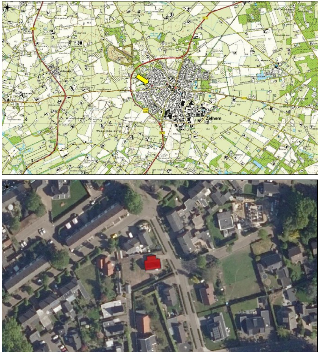
Figuur 1. De ligging en begrenzing van het plangebied aan de Papaverstraat 49 te Zelhem (afbeelding boven). Op de onderste afbeelding is de te slopen woning rood gemarkeerd.