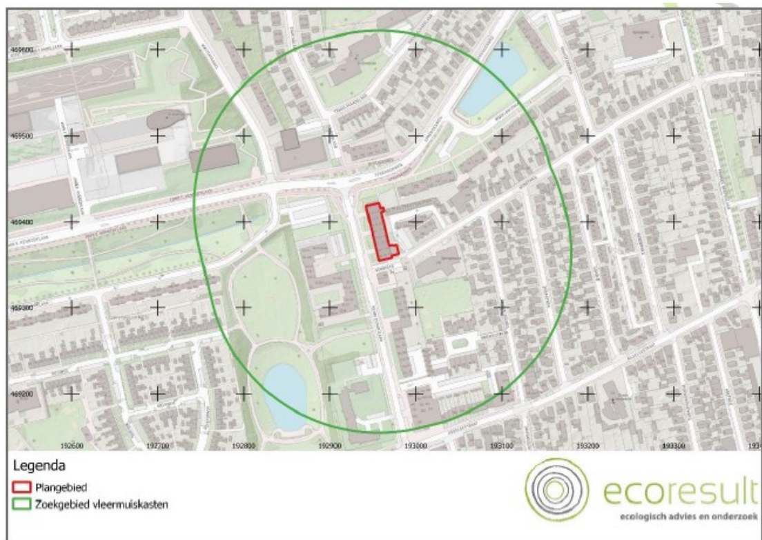
Figuur 1. Zoekgebied tijdelijke vleermuiskasten. Nadat de kasten zijn opgehangen wordt de locatie hiervan verstrekt aan de provincie Gelderland.