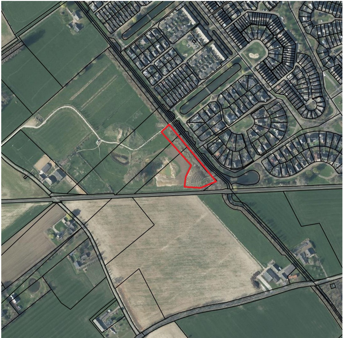
Figuur 4: Ligging herplantlocatie 2, kadastraal percelen Wehl sectie K nummer 394, 694 en 395. Oppervlakte 39 are