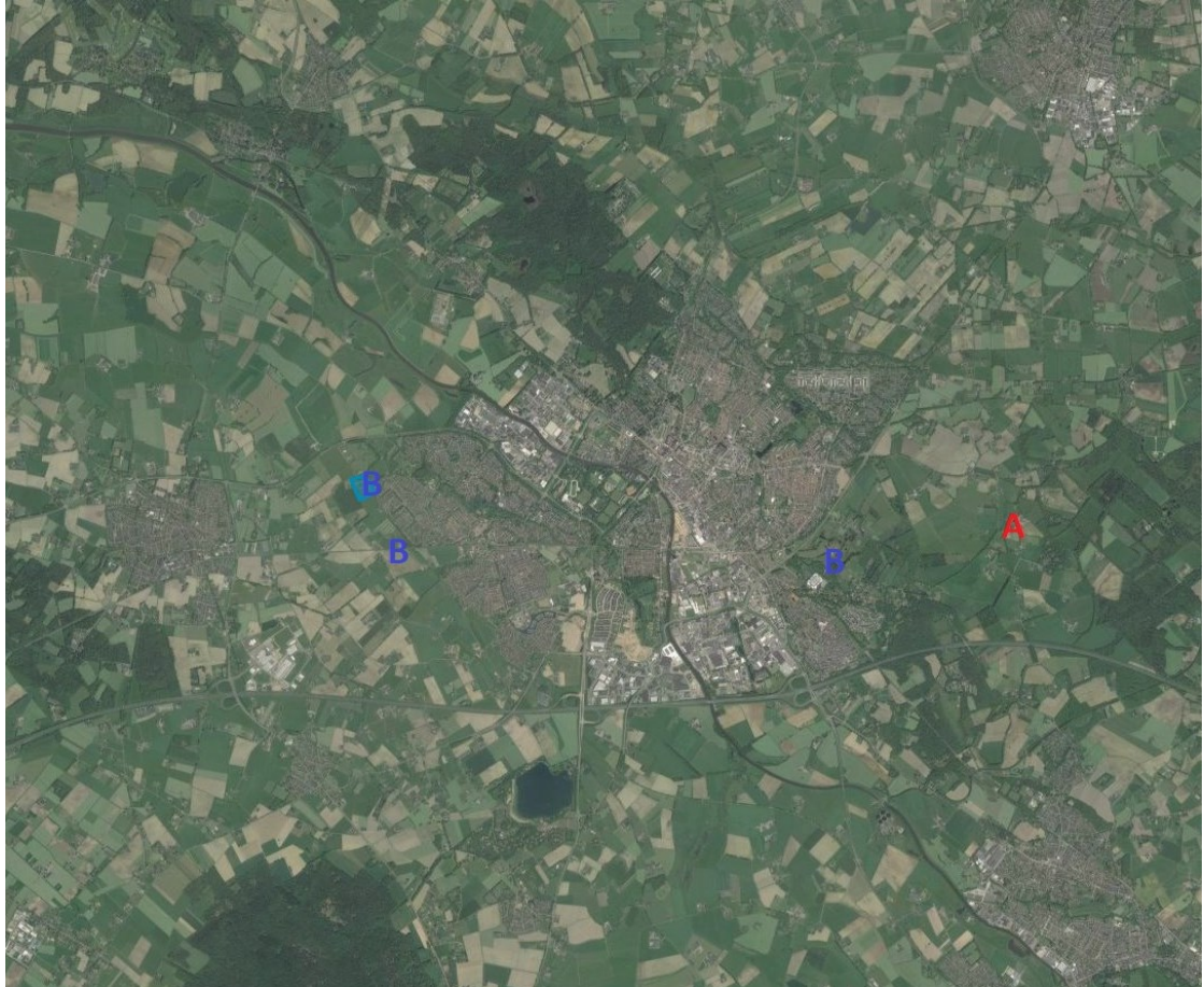
Figuur 5: Overzicht kap en herplantlocaties (A is de kaplocatie en B zijn de herplantlocaties).