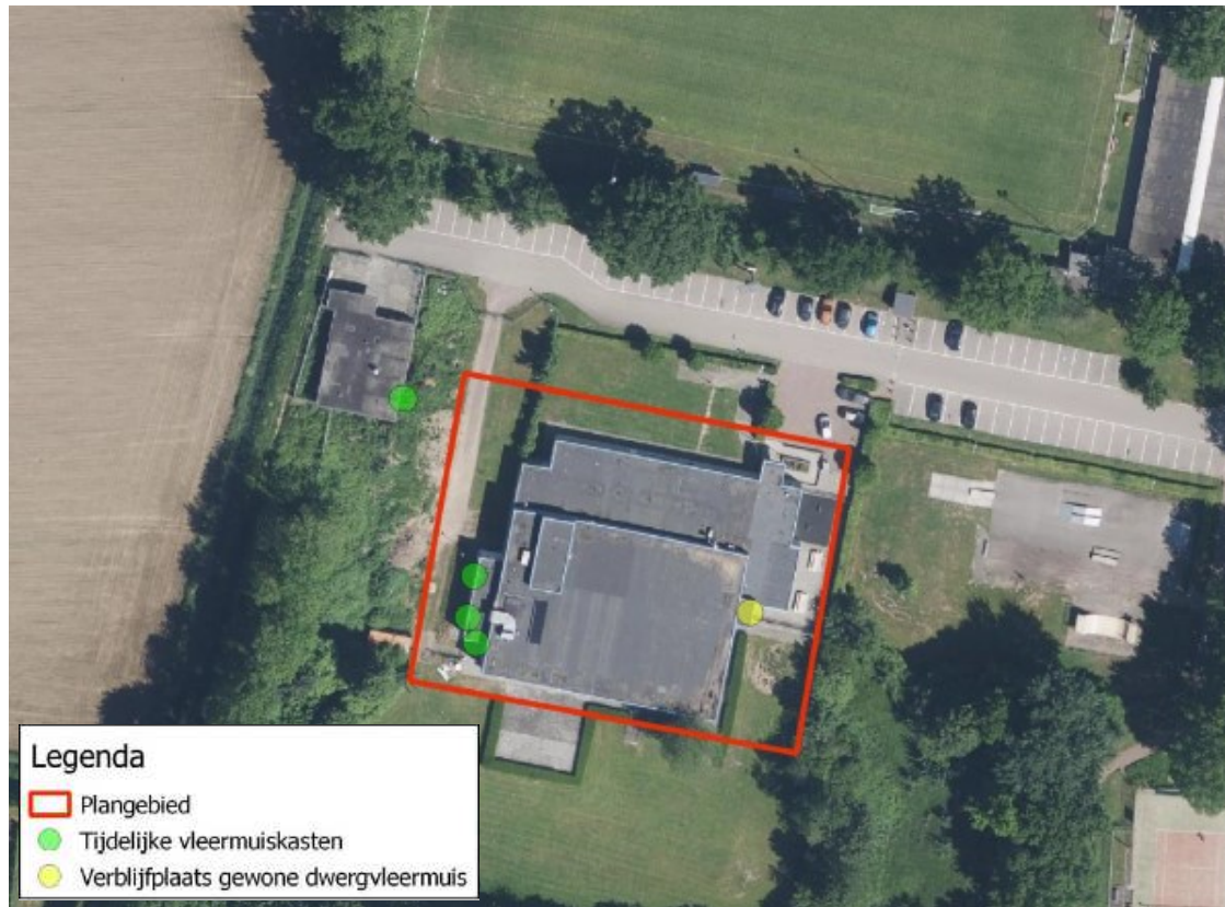
Figuur 3. Locaties tijdelijke vleermuiskasten ten opzichte van de huidige verblijfplaats van de gewone dwergvleermuis.