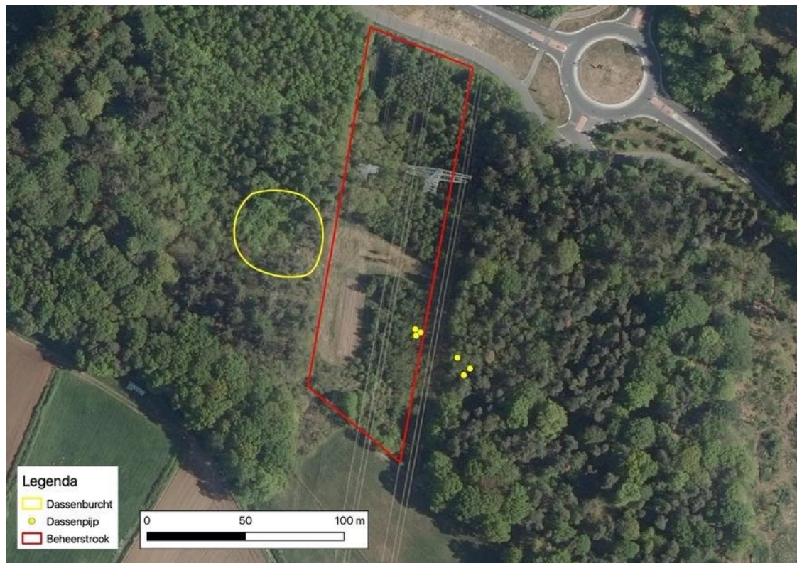
Figuur 3: Ligging van gevonden hoofd- en bijburchten van de das (resp. gele cirkel en gele stippen) binnen en buiten het plangebied.