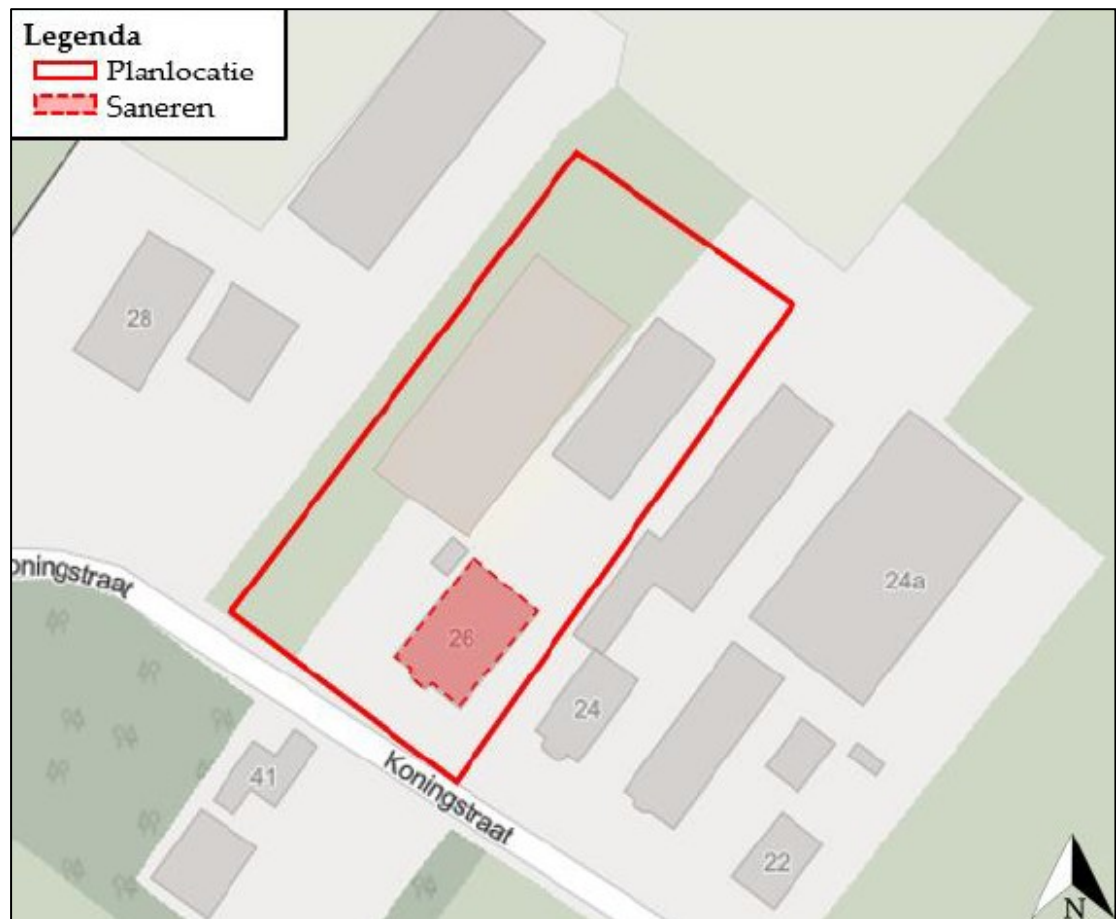
Figuur 1. De ligging en begrenzing van het plangebied aan de Koningstraat 26 te Ewijk. De planlocatie is rood omlijnd, terwijl de te slopen woning met aangebouwde stal (red: 'deel') rood gearceerd weergegeven is. De grijs gearceerde bebouwing blijft in de huidige staat behouden.