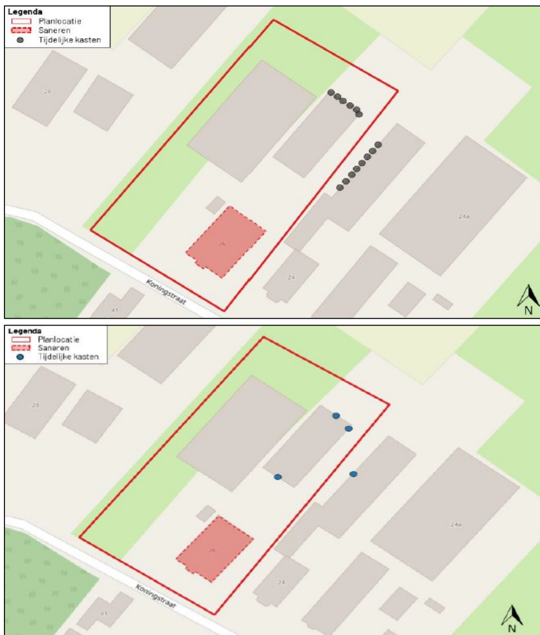
Figuur 2. De locaties van de tijdelijke voorzieningen voor huismuis (afbeelding boven) en gewone dwergvleermuis (afbeelding onder). De groene stippen op de bovenste afbeelding weergeven 14 driedelige huismuskasten van het type Diego van Faunus Nature Creations (of soortgelijk). De blauwe stippen op de onderste afbeelding weergeven 4 vleermuiskasten van het type VK MP 05 van Vivara Pro (of soortgelijk).