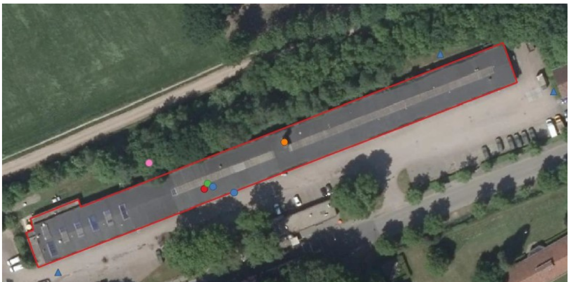
Figuur 2 Locaties verblijfplaatsen van steenmarter (rood), gewone dwergvleermuis (blauw, 2x), gewone grootoor-vleermuis (groen) en laatvlieger (oranje). Met de blauwe driehoekjes zijn (indicatief) de waarnemingen van de baltterritoria weergegeven. Bovendien is de waarneming van hazelworm in het achterliggende gazon weergegeven (roze stip).