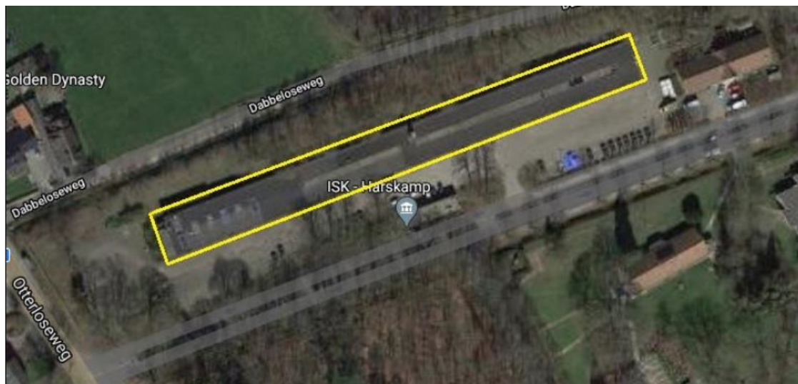
Figuur 1 Ligging complex 131 op legerplaats Harskamp aan de Otterloseweg 5.