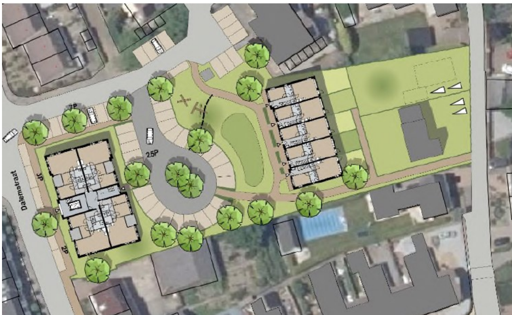
Figuur 2 Nieuwe situatie plangebied.