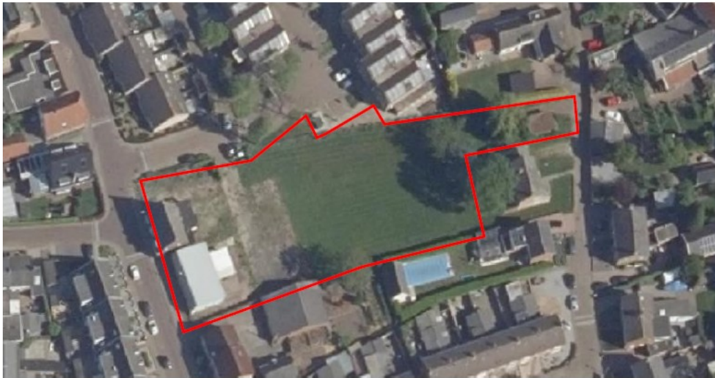
Figuur 1 Plangebied (rood omkaderd).