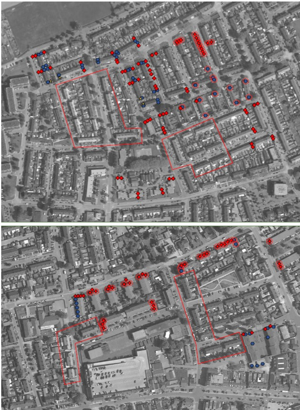
Figuur 3: locaties tijdelijke kasten. In rood de tijdelijke huismus- en/of gierzwaluwkasten en in blauw de vleermuiskasten. De rood omlijnde tekens betreffen de eerder aangebrachte kasten (Voerman, 2022)