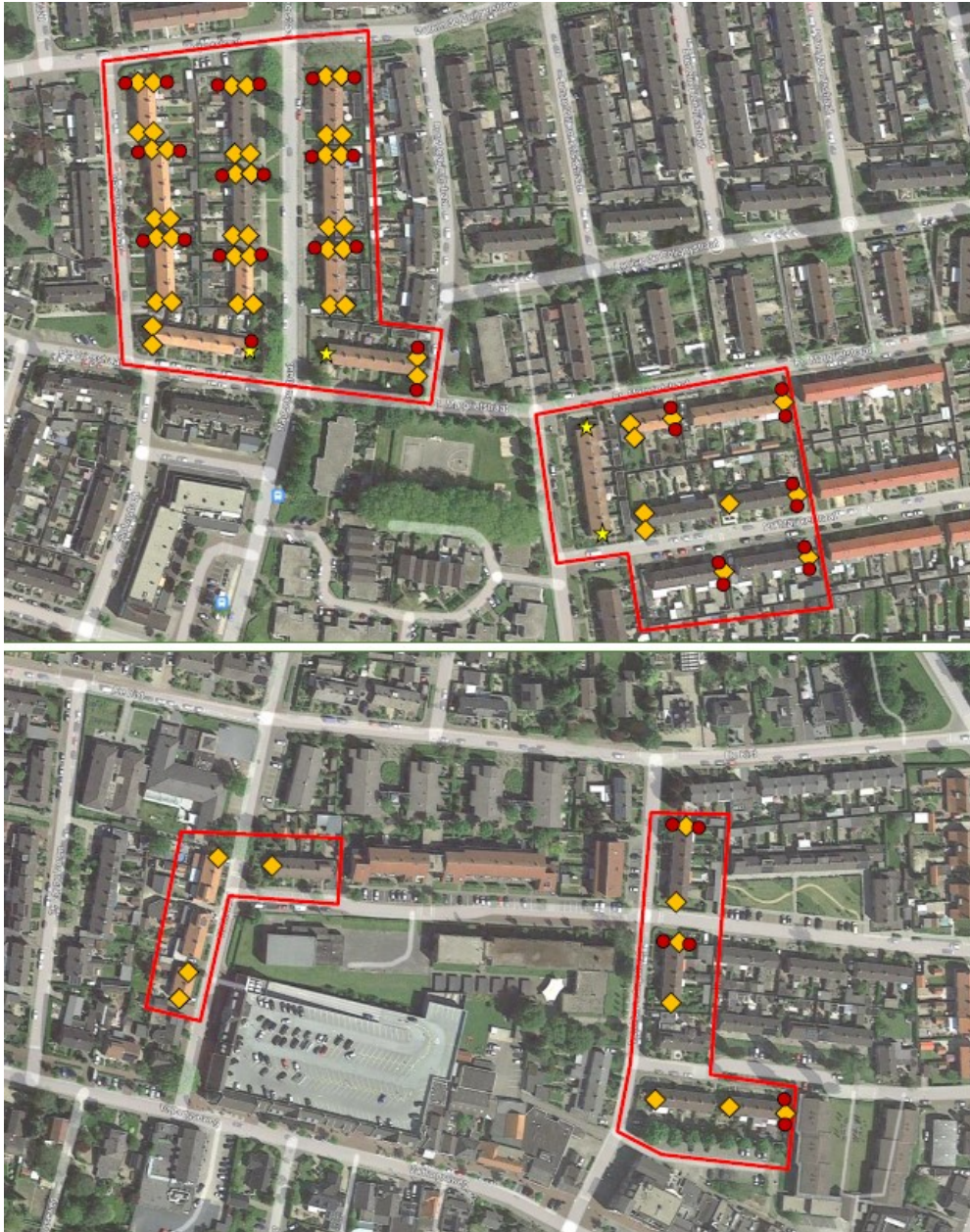
Figuur 4: locaties permanente voorzieningen. Gele ruiten geven de locaties weer van de kleine inmetzelstenen voor vleermuizen en de gele ruiten de geschakelde inmetzelstenen. In rood de inmetzelstenen voor de gierzwaluw (Voerman, 2022)