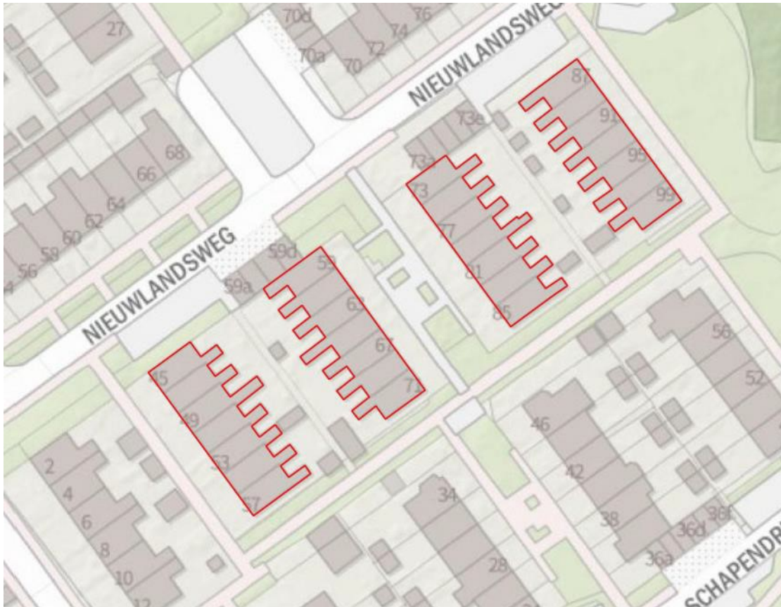
Figuur 2. Detailkaart projectgebied (rode contouren).