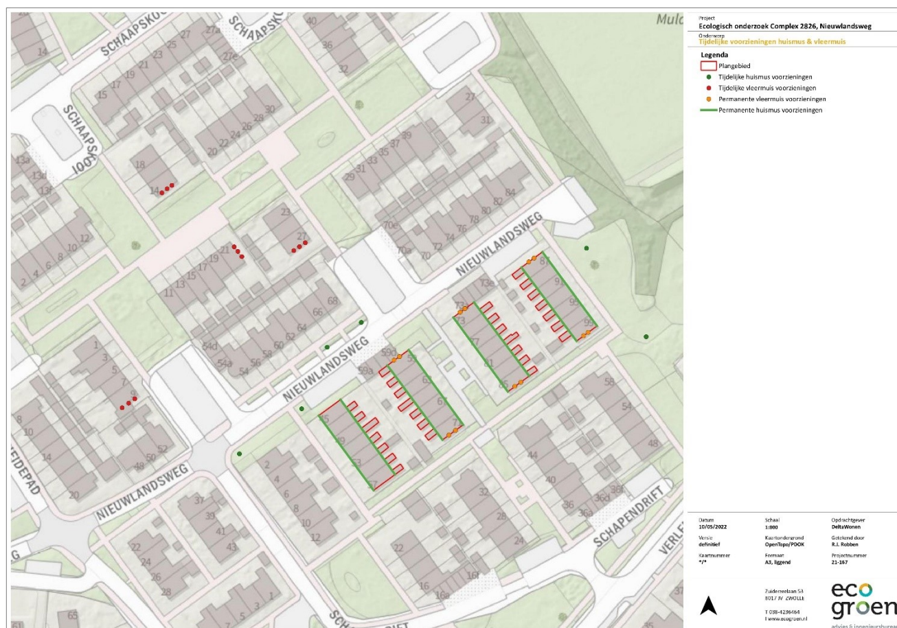
Figuur 1. Tijdelijke en permanente voorzieningen voor de gewone dwergvleermuis en huismus.