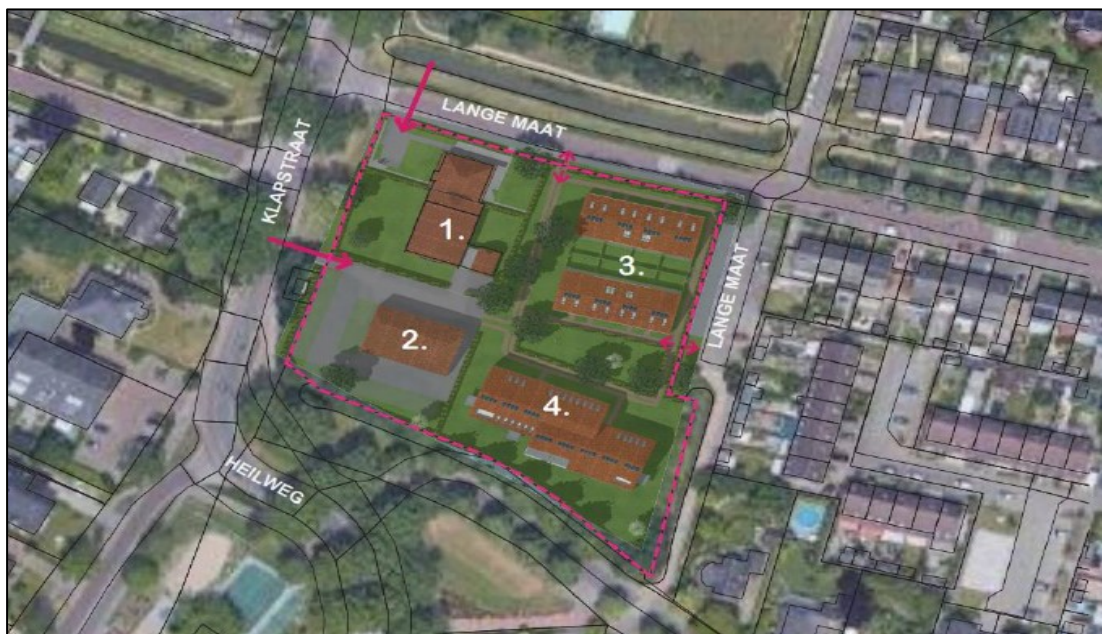
Figuur 1. De ligging en begrenzing van het plangebied aan de Klapstraat 185 te Westervoort (rood omlijnd, afbeelding boven). Op de onderste afbeelding is de beoogde nieuwe situatie weergegeven. 1: twee nieuwe woningen in de voormalige woning; 2: werkschuur bergingen en parkeerplaatsen; 3: acht nieuwe woningen en 4: zestien nieuwe appartementen.