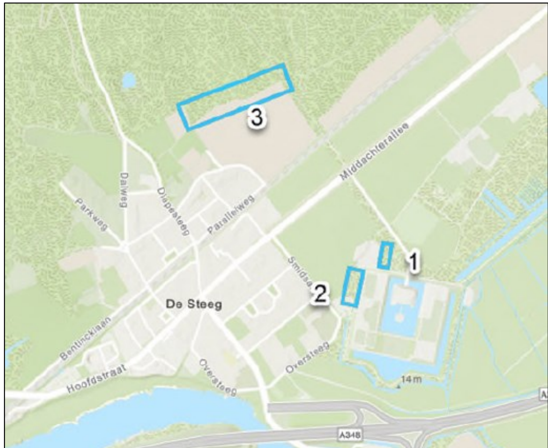
Figuur 1. De ligging en begrenzing van het plangebied op Landgoed Middachten aan Landgoed Middachten 3 te De Steeg. Het plangebied is verdeeld in drie deelgebieden. (1) het gebied met te kappen bomen (10) ten oosten van de werkplaats; (2) het gebied met de te kappen bomen (20) aan het Rentmeesterlaantje; (3) het gebied met de te kappen bomen (30) op de Middachter enk. De bomen in deelgebied 1 en 2 worden in 2022 gekapt. De bomen in deelgebied 3 worden in 2023 gekapt.