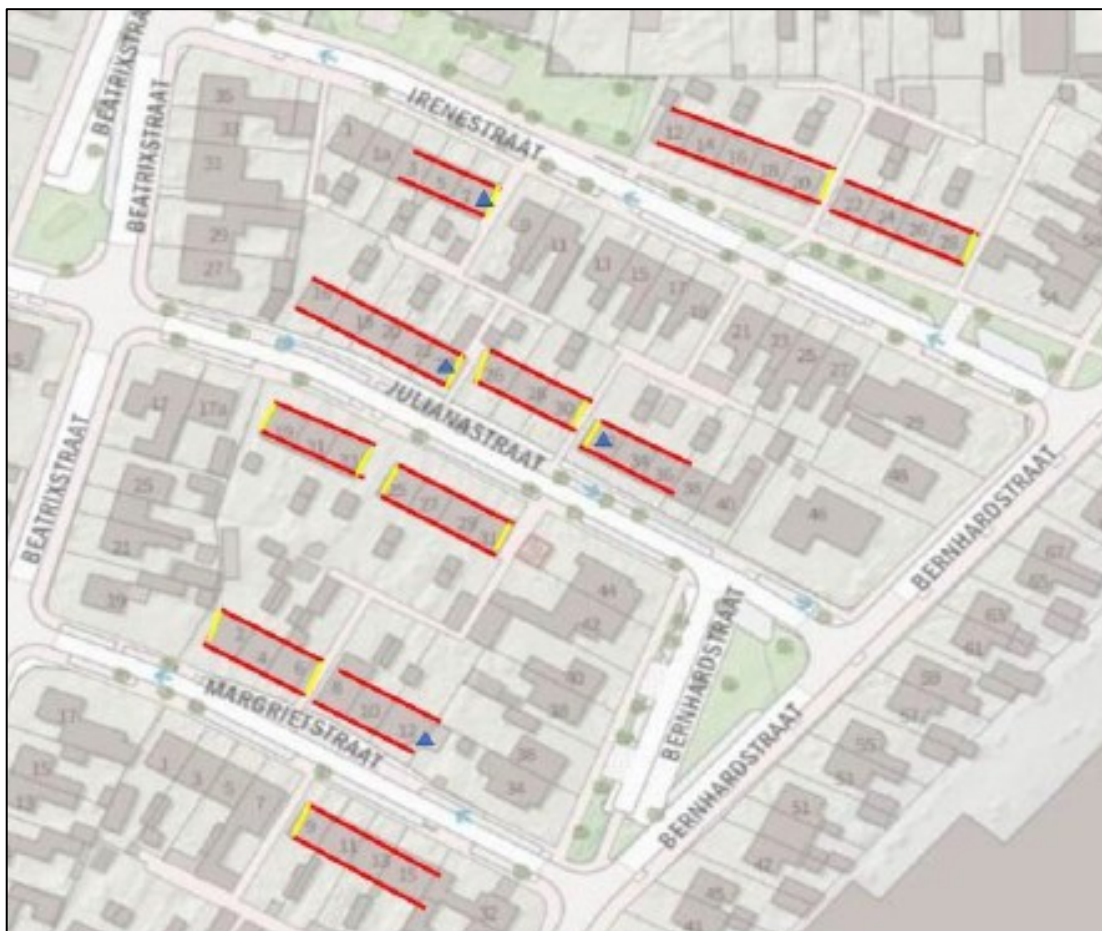
Figuur 3. De locaties van de tijdelijke en permanente voorzieningen voor gewone dwergvleermuis, ruige dwergvleermuis en laatvlieger. Op de kopgevels (gele strepen) zijn per kopgevel 2 tijdelijke vleermuiskasten van het type VK WS 11 van Vivara Pro aangebracht, in totaal 28 stuks ter mitigatie van de verblijven van gewone dwergvleermuis en ruige dwergvleermuis. De blauwe driehoeken weergeven 4 permanente voorzieningen voor laatvlieger in de vorm van gevelbetimmering, van het type VMN1 van Unitura (of soortgelijk). De rode strepen weergeven de locaties van te creëren gaten/ruimtes bij de muur achter de betimmering, 4 per zijgevel van de woningen, in totaal goed voor 88 verblijfplaatsen. Als extra ondersteuning van de populatie vleermuizen in de wijk zijn er verspreid over de wijk 4 grote kraamkasten opgehangen.