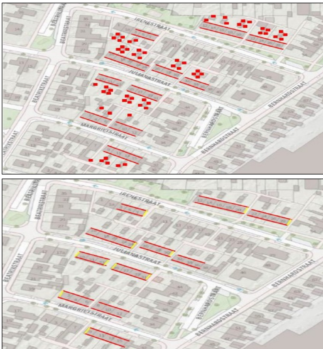
Figuur 2. De locaties van de tijdelijke en permanente voorzieningen voor huismus (boven) en gierzwaluw (onder). De rode vierkanten op de bovenste afbeelding weergeven 60 tijdelijke huismuskasten van het type Systeem-nestkast huismus eco 34 mm van Vivara Pro. De rode lijnen weergeven verhoogd vogelschroot tot op de 3e panlat aan beide zijden van de te renoveren woningen. Op de onderste afbeelding zijn op de locaties van de gele strepen per locatie 6 tijdelijke gierzwaluwkasten van het type NK GZ o8 geplaatst, in totaal 66 kasten. De rode strepen weergeven de locaties van maatwerk in de nieuwe situatie: ruimtes in de betimmeringen van de dakgoten en dakranden. Bij elke woning betreft dit twee voorzieningen, in totaal goed voor 76 permanente locaties voor gierzwaluw.