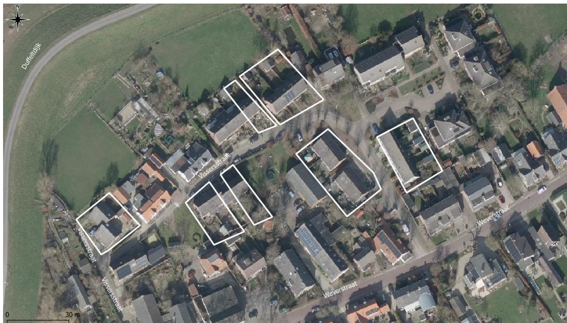
Figuur 2. Luchtfoto projectgebied (witte kaders).