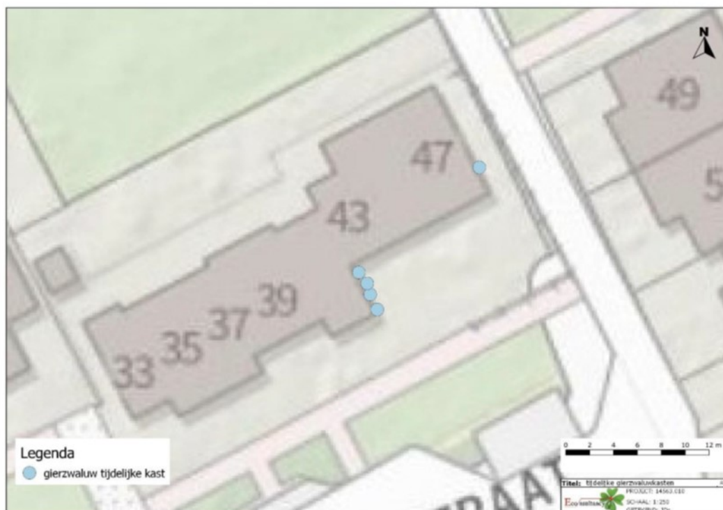
Figuur 2. Locaties tijdelijke gierzwaluwkasten.