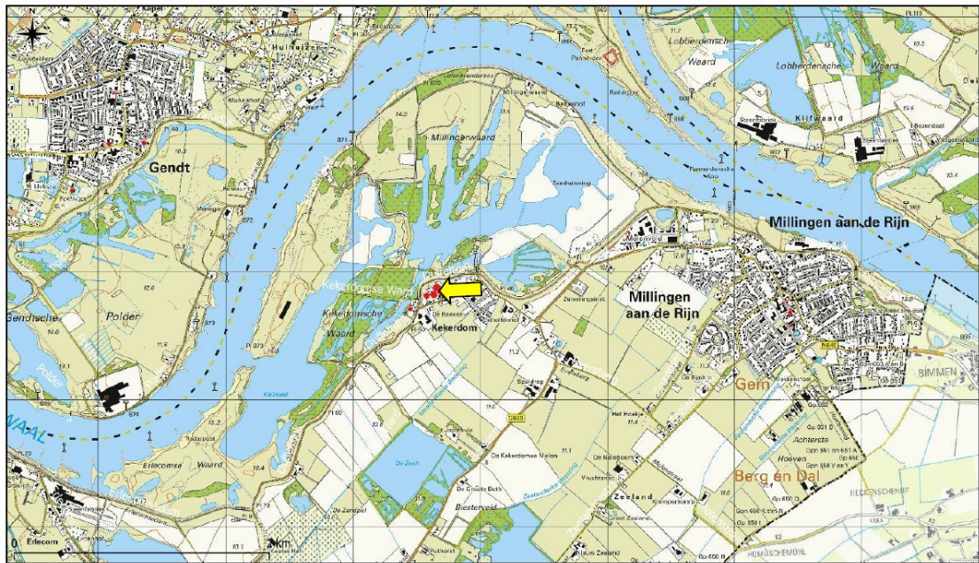
Figuur 1. Topografische ligging projectgebied.