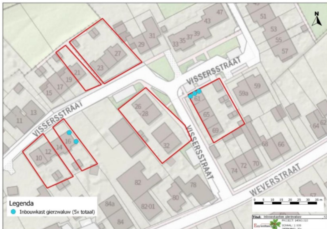
Figuur 3. Locaties inbouwstenen gierzwaluw.