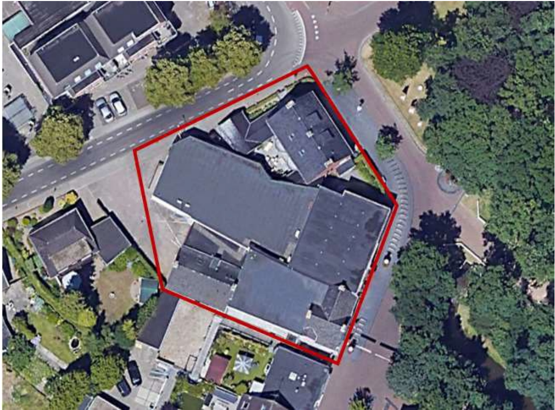
Figuur 2. Luchtfoto projectgebied (rode kader).