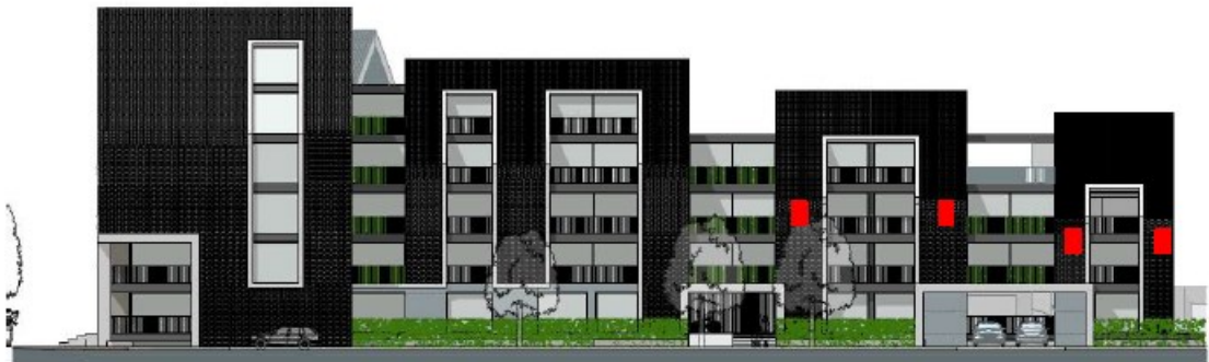
Figuur 2. Locaties inmetsselstenen in concept-tekening (rode rechthoeken), situering aan de Herenstraat. Deze inmetsselstenen worden zodanig geplaatst dat zij zo dicht mogelijk in de buurt van de huidige verblijfplaats zijn gesitueerd, met dezelfde oriëntatie.