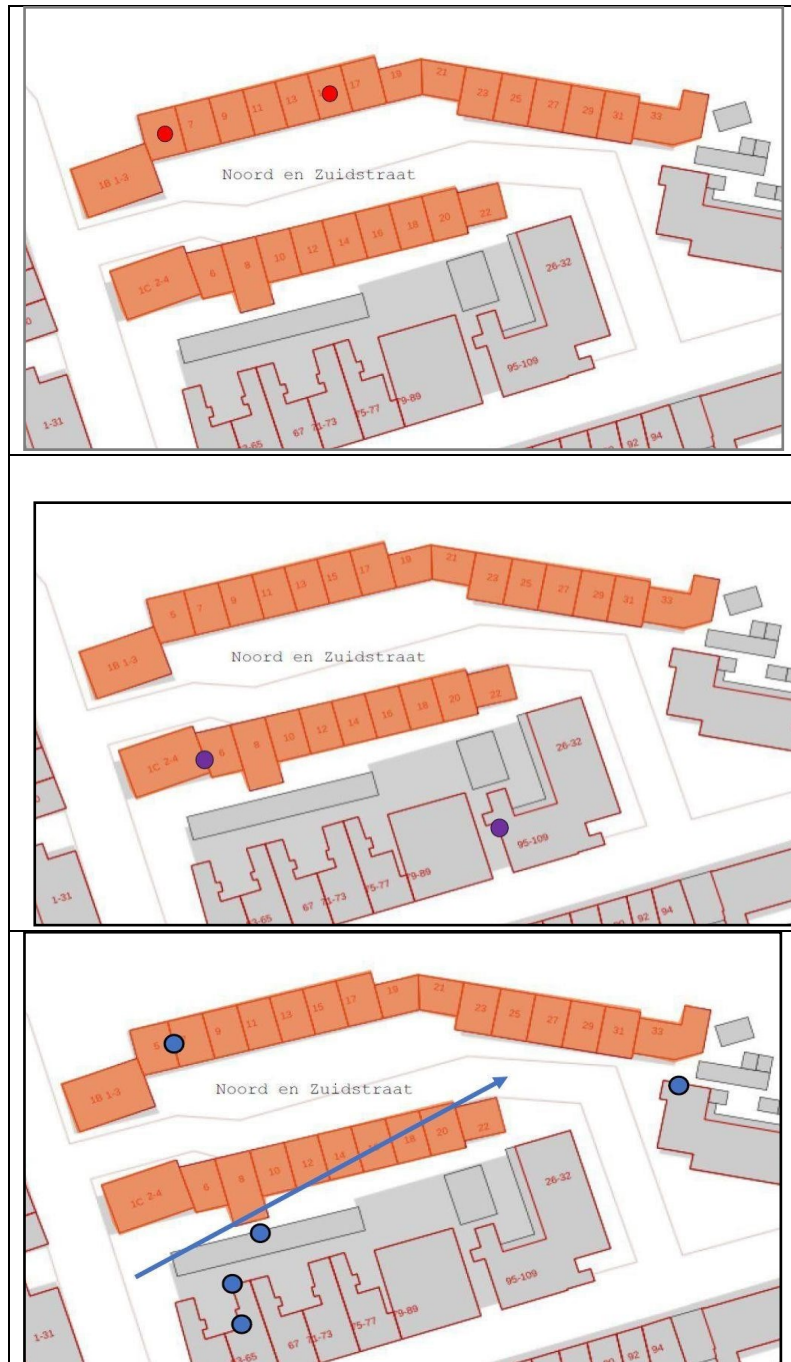
Figuur 3. Nest- en verblijfplaatsen van huismus, gierzwaluw en gewone dwergguleermuis (resp. rode stippen, donkerblauwe stip en blauwe stip met zwarte omranding).