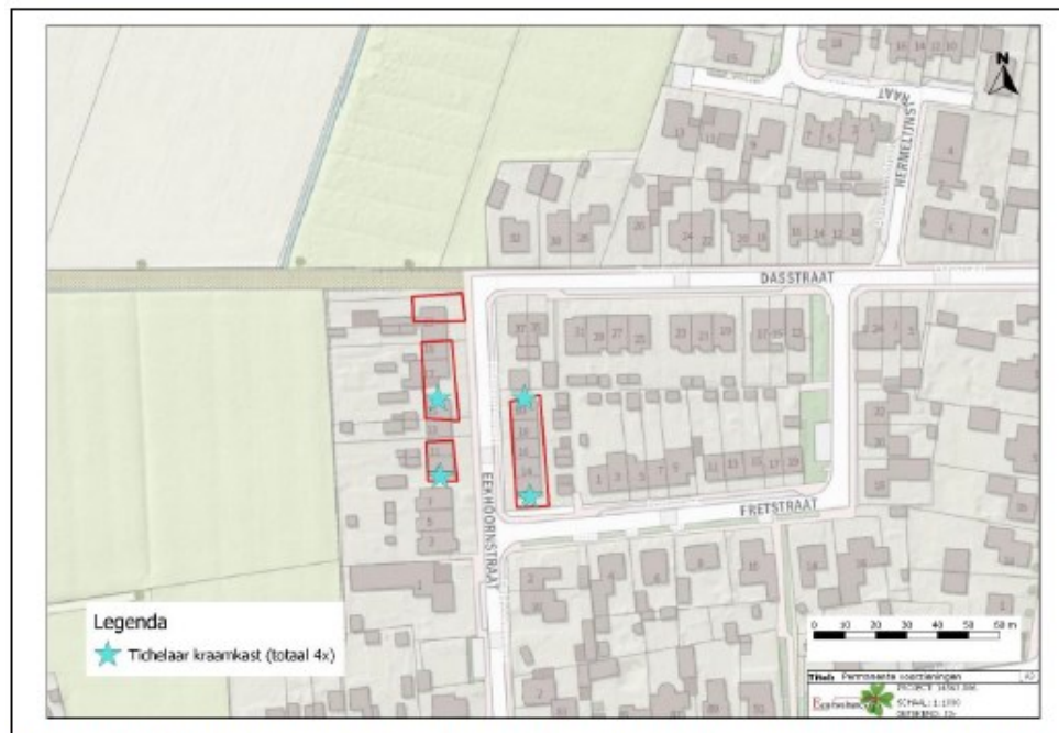
Figuur 29. Geplande locaties inbouw Tichelaarkast gewone dwergvleermuis in de toekomstige situatie (blauwe ster, totaal vier inbouwkasten).