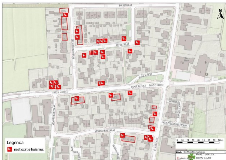
Figuur 2. Vastgestelde nestlocaties van de huismus op en rond de onderzoekslocatie.