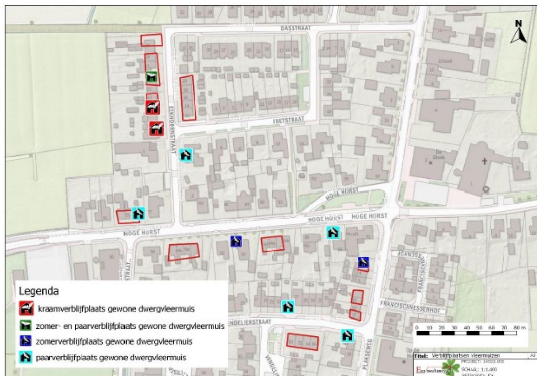
Figuur 3. Aangetroffen verblijfplaatsen gewone dwergvleermuis.