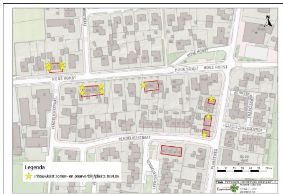
Figuur 30. Geplande locaties inbouw vleermuiskasten IB VL 06 gewone dwergvleermuis in de toekomstige situatie (gele ster, totaal twaalf inbouwkasten).