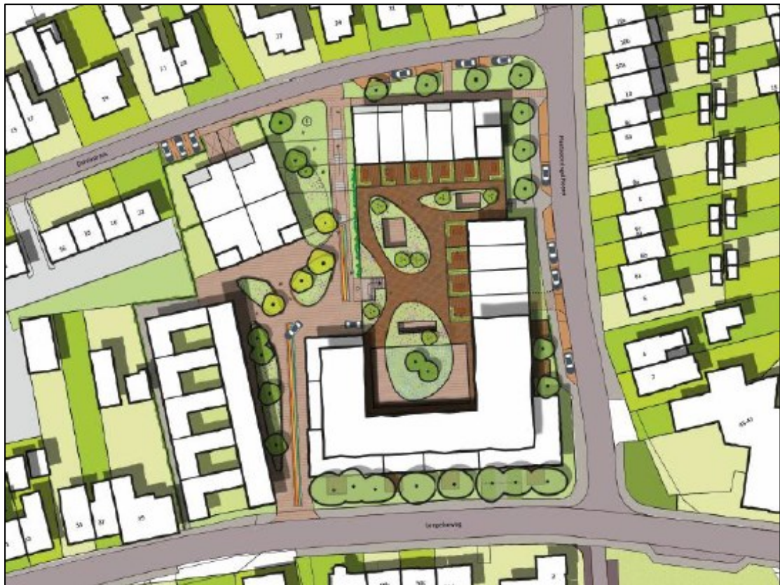
Figuur 4. Een overzicht van de nieuwe situatie met 34 nieuwe woningen, een parkeerplaats (centraal gelegen) en een daktuin.