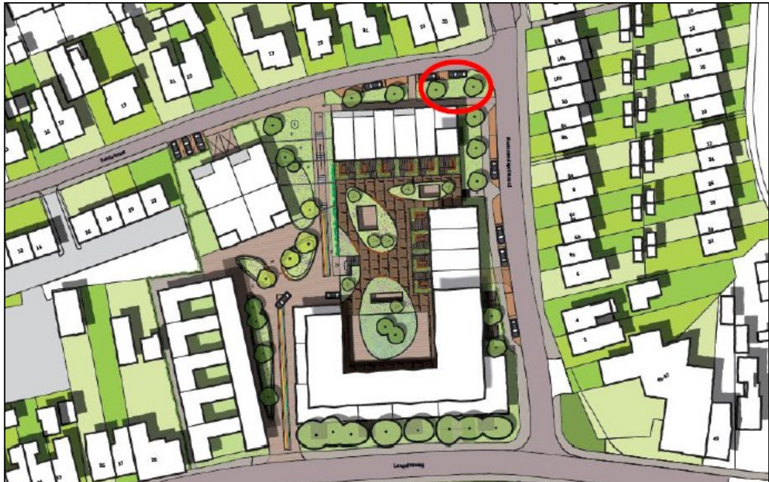
Figuur 3. De locatie waar de alternatieve beplanting (meidoorn, haagbeuk, hult en/of liguster) voor de huismus wordt aangebracht, vóórdat de bestaande haag in de noordoostelijke hoek wordt verwijderd (rode cirkel). De exacte inrichting wordt zodra deze bekend is aan de provincie Gelderland verstuurd.