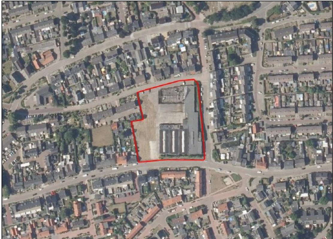
Figuur 1. De ligging en begrenzing van het plangebied ter grootte van 0,76 hectare aan de Lengelseweg 43 te 's-Heerenberg (rood omlijnd).