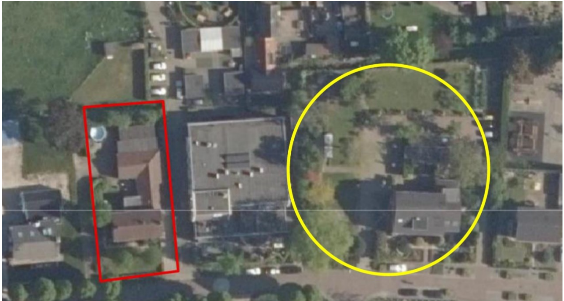
Figuur 2: Locatie tijdelijke huismus- en vleermuiskasten binnen gele cirkel t.o.v. plangebied binnen rode kader. De huismuskasten hangen aan de westelijke gevel van de woning (Mulder, M., 2022)