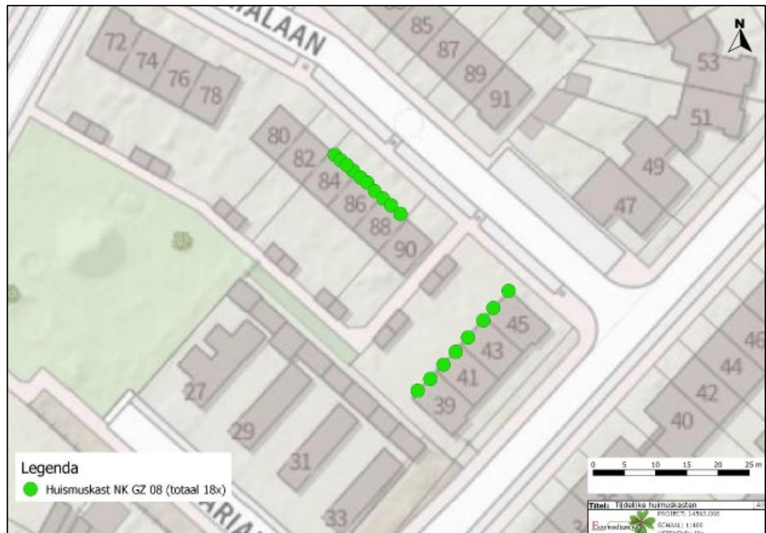
Figuur 2. De locaties van de tijdelijke voorzieningen voor huismus. De groene stippen weergeven de locaties van 18 tijdelijke huismuskasten van het type NK GZ 08 van Vivara Pro.