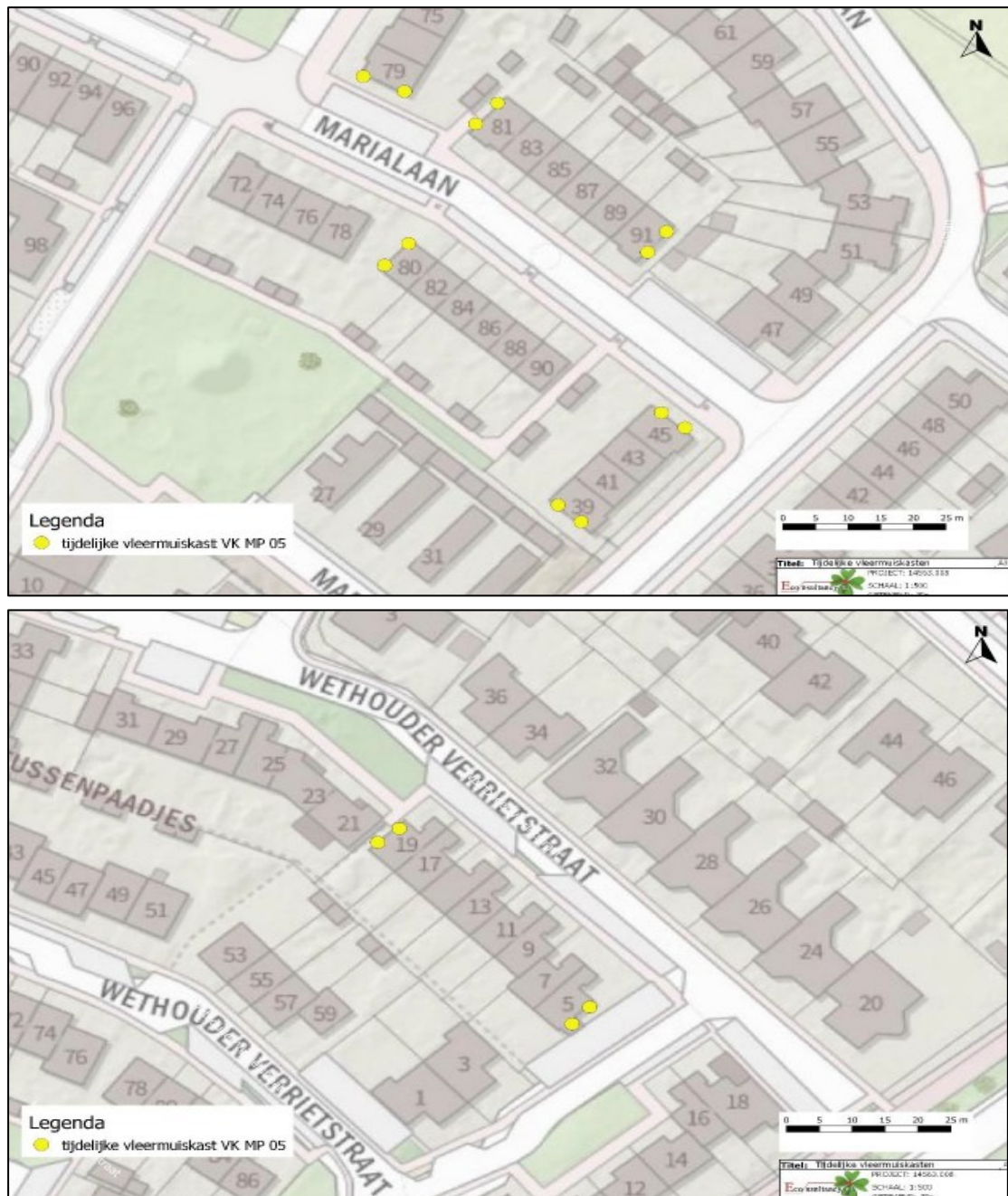
Figuur 3. De locaties van de tijdelijke voorzieningen voor gewone dwergvleermuis. De gele stippen weergeven de locaties van 16 tijdelijke vleermuiskasten van het type VK MP 05 van Vivara Pro nabij het plangebied.