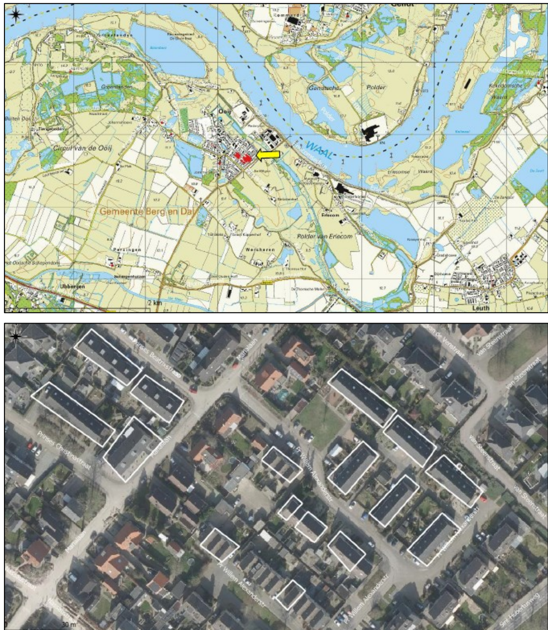
Figuur 1. De ligging en begrenzing van het plangebied aan de Marialaan 5 en omgeving te Ooij. Op de onderste afbeelding zijn de 45 te renoveren woningen wit omlijnd.