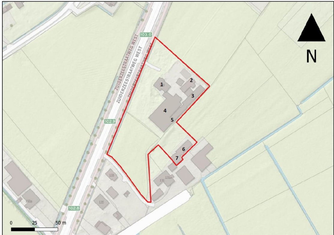
Figuur 1. Ligging en begrenzing projectgebied. Alle opstallen binnen het projectgebied worden gesloopt. Verklaring van de nummers: 1. woonboerderij; 2. hooiberg en hooisluur; 3. oude koeienstal; 4. houten schuur; 5. houten schuur; 6. stenen schuur; 7. stenen schuur.