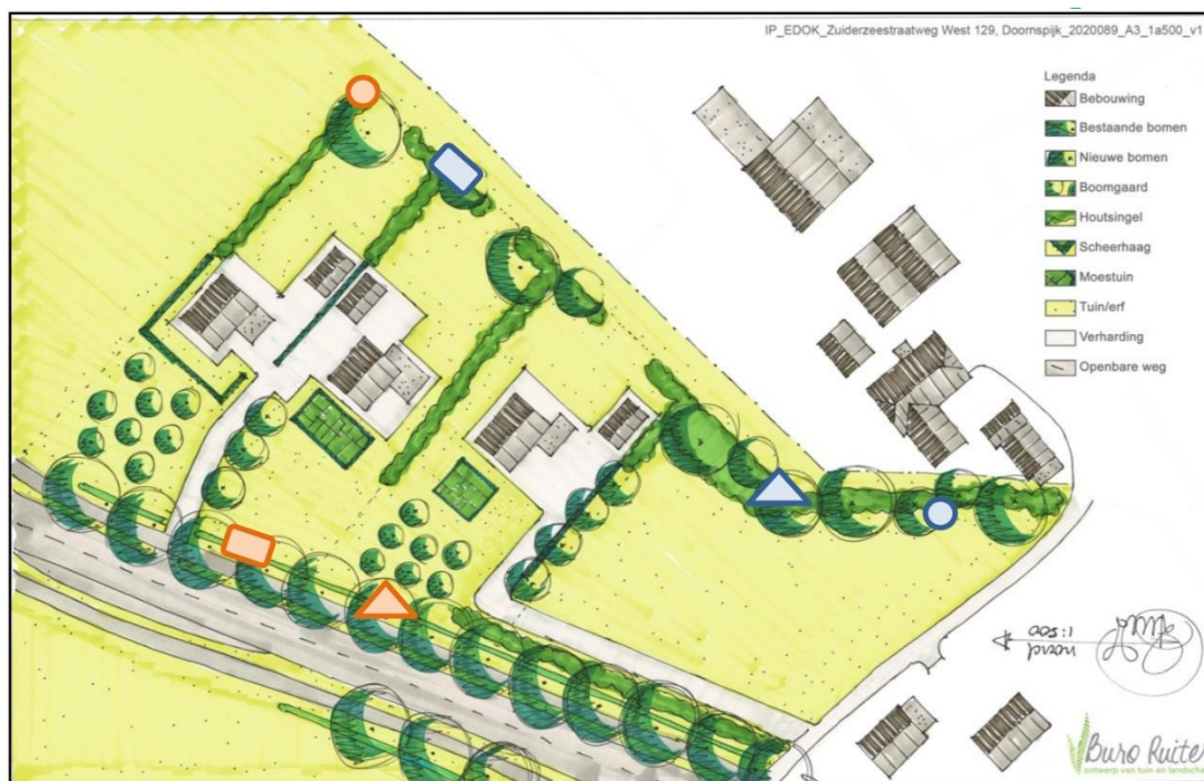
Figuur 2. Indicatie voor locaties verblijfplaatsen en rustplaatsen. Vierkant: steenmarterkast, Driehoek: martertakkenhoop, Cirkel: open kast. In het oranje de verblijfplaatsen die voor aanvang van de werkzaamheden geplaatst worden. In het blauw de verblijfplaatsen die nadien gerealiseerd worden. Tevens zijn de groenstructuren weergegeven.