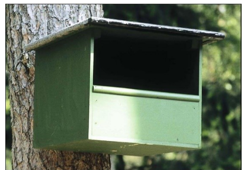
Figuur 3. Overzicht van de te plaatsen verblijf- en rustplaatsen voor de steenmarter. Boven: marterkasten; linksonder: martertakkenhoop; rechtsonder: open kast (zoals een torenvalkkast) als rustplaats.