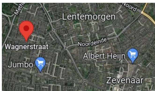
Figuur 1: Plangebied (Elerwoude, 2022)