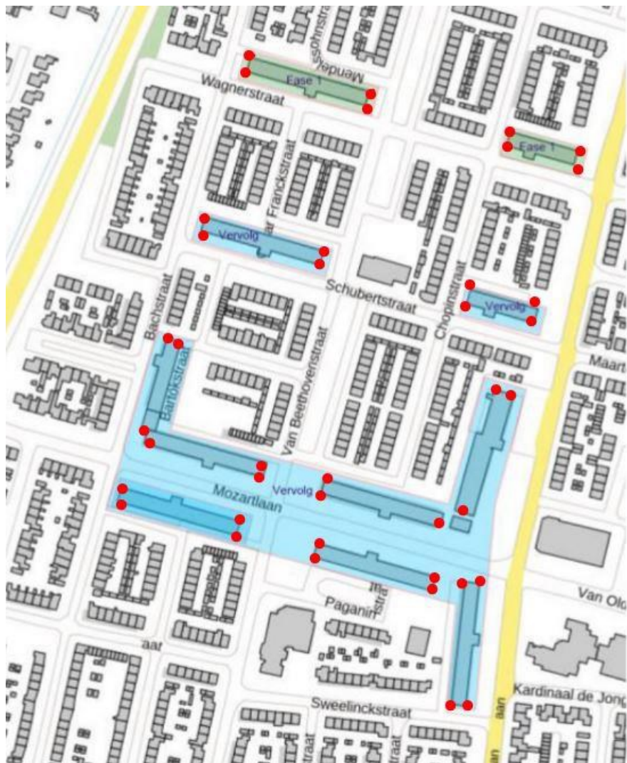
Figuur 1: Permanente mitigatie (Elerwoude, 2022)