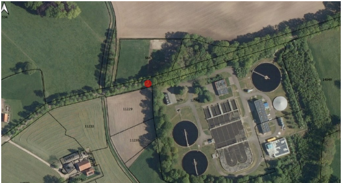
Figuur 5: Ligging van de solitaire eik die aanvullend wordt gekapt en gecompenseerd.