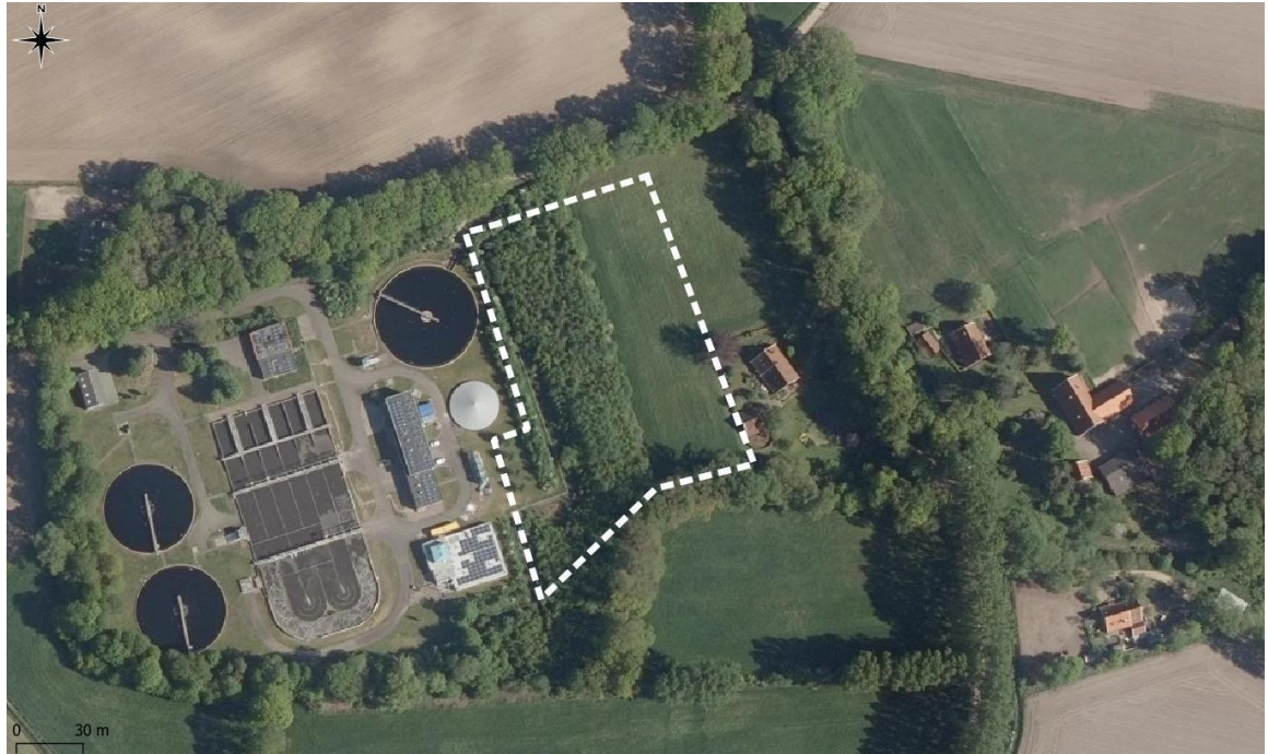
Figuur 2: Luchtfoto plangebied en compensatielocatie Honesweg 14 te Winterswijk.