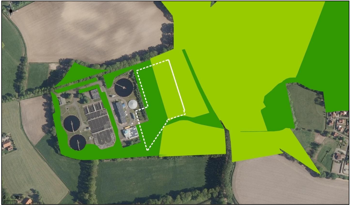
Figuur 3: Ligging van de planlocatie ten opzichte van Gelders Natuur Netwerk (GNN) en Groene Ontwikkelingszone (GO).