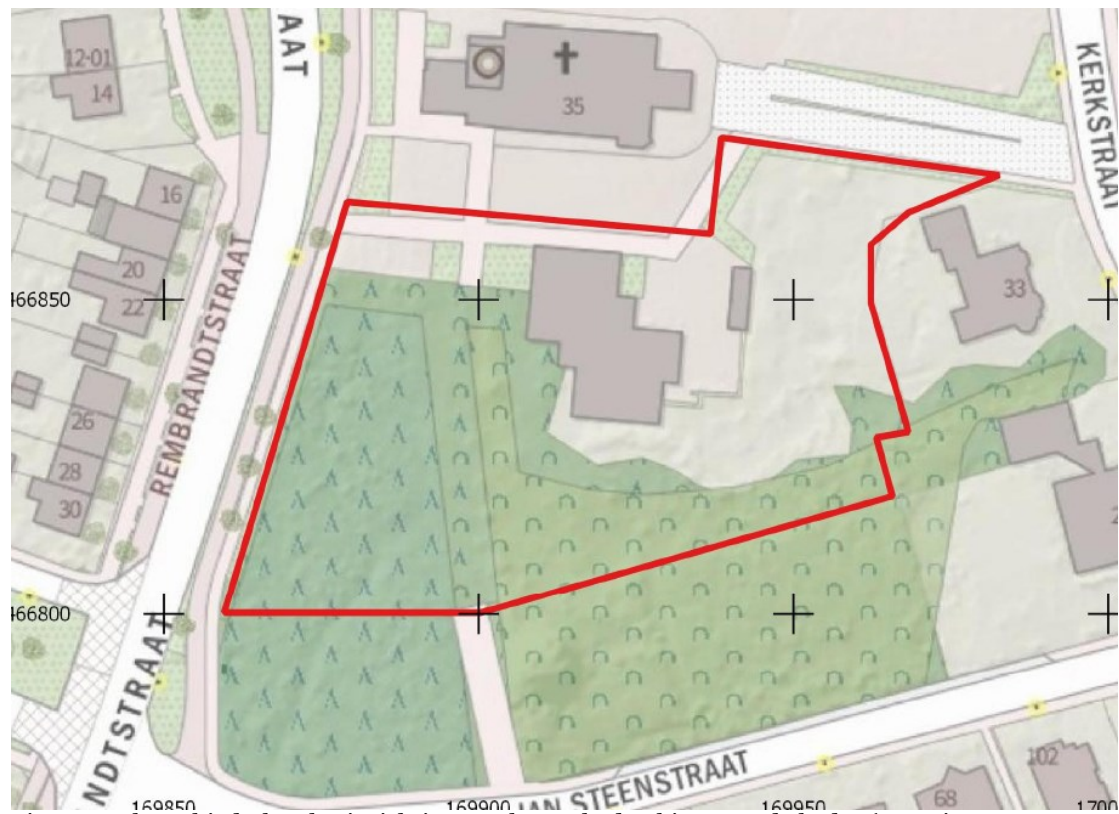
Figuur 1: Plangebied t.b.v. herinrichtingswerkzaamheden binnen rode kader (De Vries en Van Meurs, 2020)