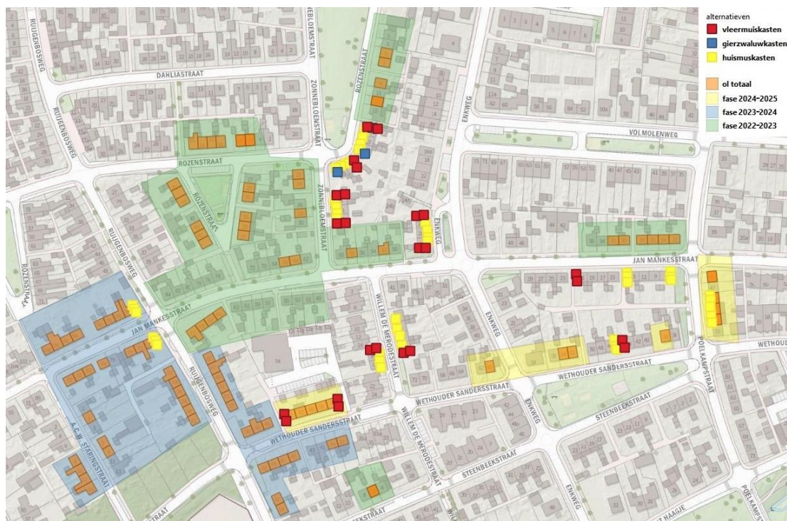
Figuur 1. Locaties reeds geplaatste tijdelijke kasten voor huismuis, gierzwaluw en vleermuisen.