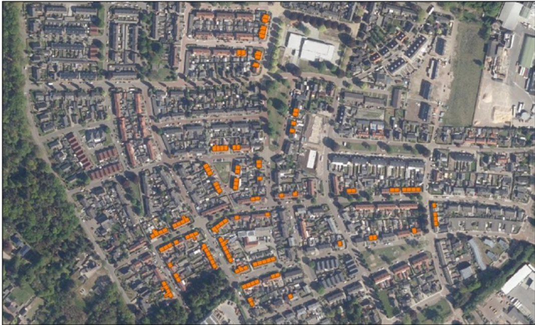
Figuur 2. Luchtfoto projectgebied.