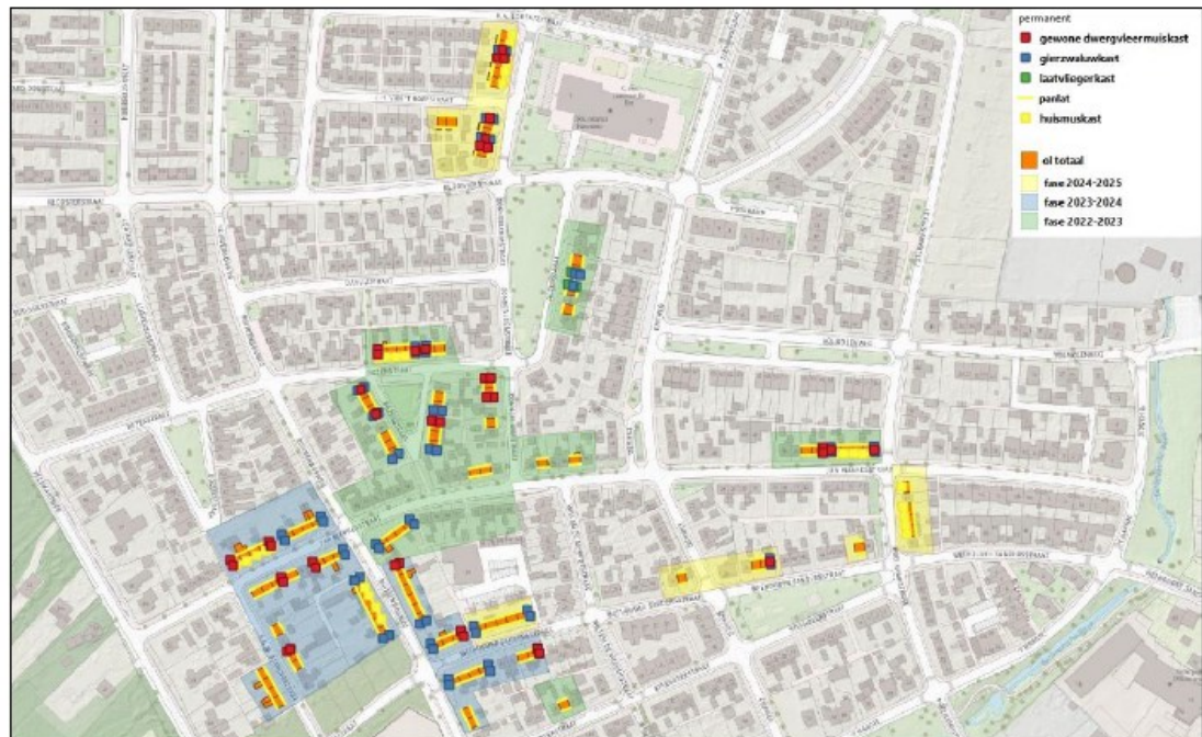
Figuur 2. Indicatieve locaties permanente voorzieningen voor huismuis, gierzwaluw en vleermuisen.