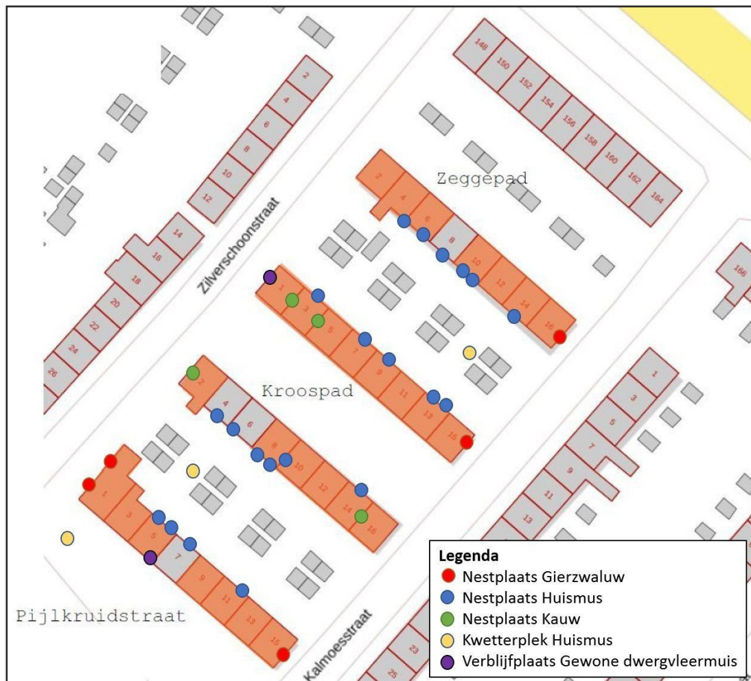
Figuur 3. Nest- en verblijfplaatsen van huismus (blauwe stippen), gierzwaluw (rode stippen) en gewone dwergvleermuis (paarse stippen).