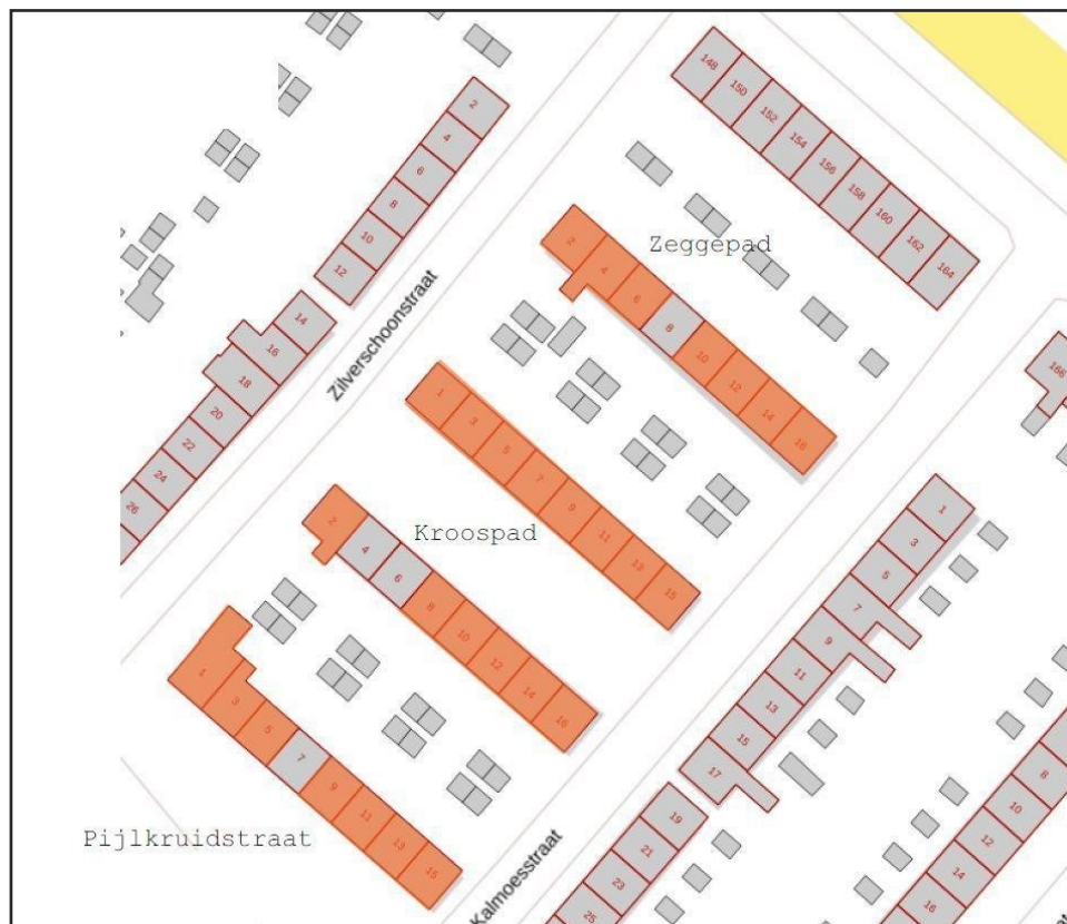
Figuur 2: Ligging van aan te pakken 28 woningen binnen het projectgebied (de lichtrode woningen). De 4 grijze woningen zijn in particulier bezit.