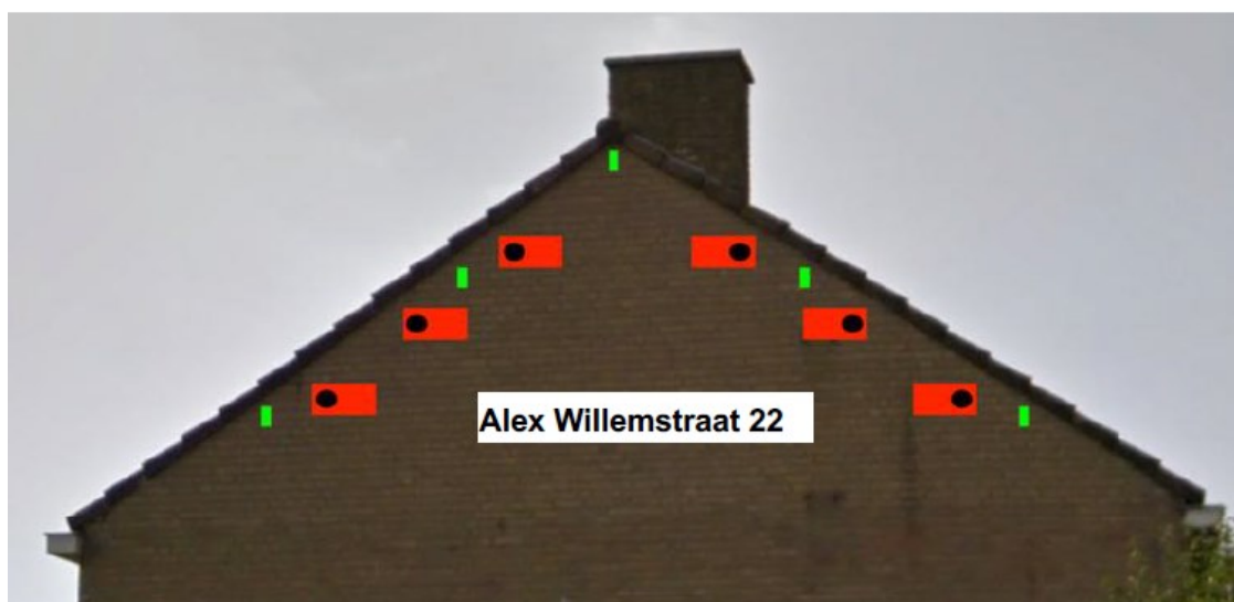
Figuur 2: Locaties permanente voorzieningen. In rood de inmetselfkasten voor de gierzwaluw en in groen de open stootvoegen voor vleermuizen (Cardinaals, J.T.B., Koopman-Van Roon, A.D.G., 2022).