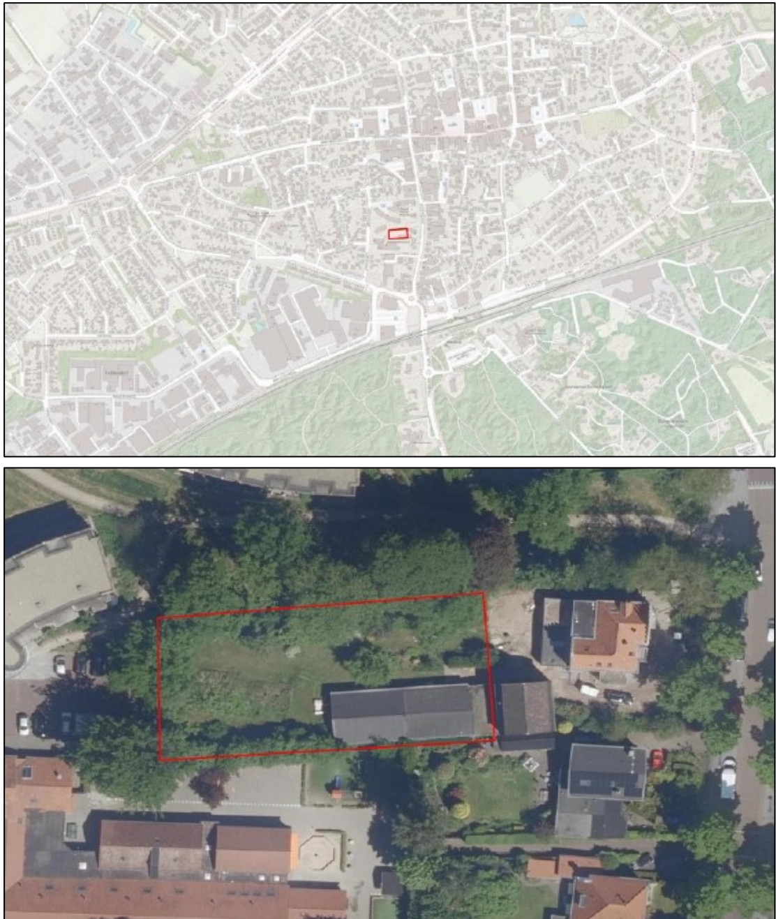
Figuur 1. De ligging en begrenzing van het plangebied aan de Stationstraat 36-38 te Nunspeet. Het plangebied met de te slopen schuur is rood omlijnd weergegeven.