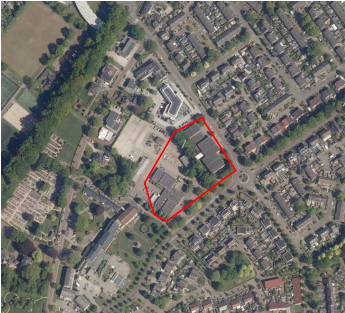
Figuur 1: Plangebied binnen rode kader (Foreest Groen Consult B.V., 2022)