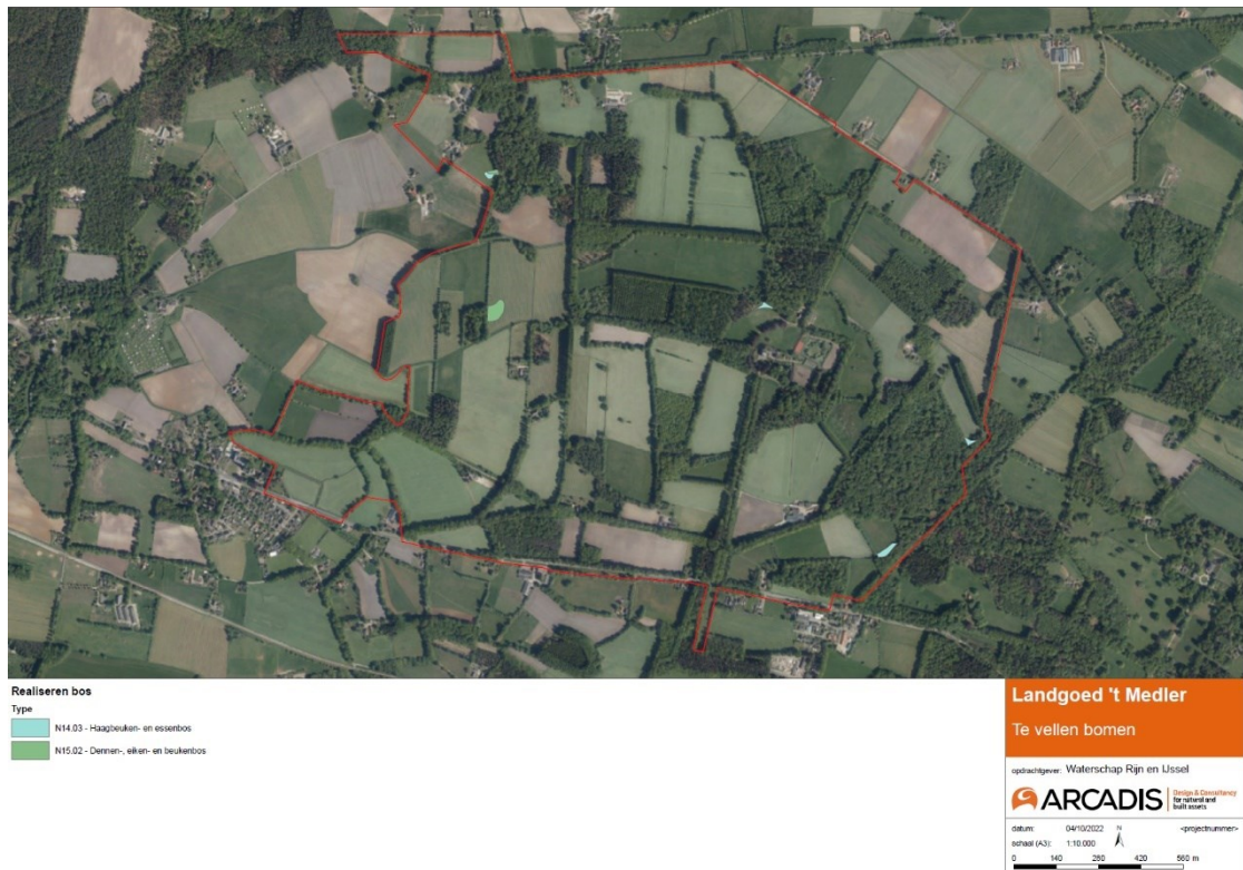
Figuur 2: Kaart herplantlocaties Landgoed 't Medler met een totaal oppervlak van 53,12 are of 5312 m 2 . Voor groot formaat zie bijlage 4.