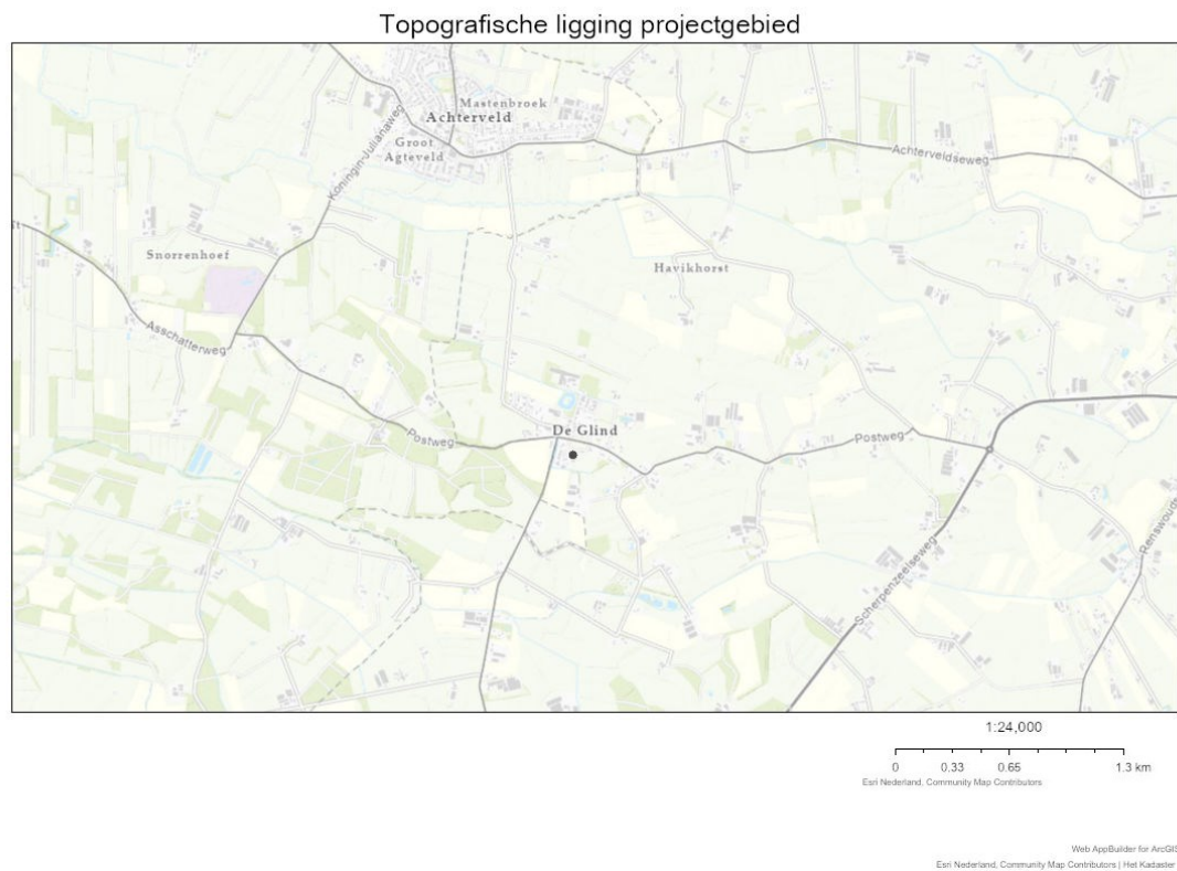
Figuur 1. Topografische ligging projectgebied