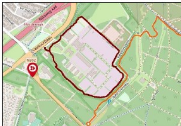
Figuur 1. MTB-route rond Bouw- & Infrapark Harderwijk

Door de nieuwbouw zal het deel van de MTB-route die rond het Bouw & Infrapark en door het plangebied loopt opgeheven worden. Zie figuur 1.