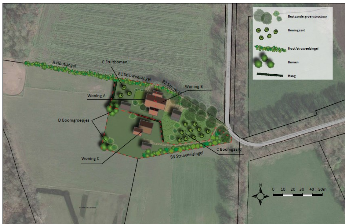
Figuur 3. Een overzicht van de landschappelijke inpassing in de nieuwe situatie. Dit betreft de aanleg van twee nieuwe boomgaarden (fruitbomen), drie hout- en struweelsingels, enkele solitaire bomen/boomgroepjes en een haag. Woning A en B bevinden zich in de woonboerderij (voor- en achterhuis) en woning C betreft de tot woning om te bouwen schuur. Nadere specificatie met o.a. de inheems aan te planten soorten en het beheer en onderhoud van de groeninrichting in: 'Landschappelijk inpassingsplan Mentinkweg 13 Winterswijk' (Buro Collou, d.d. 3 mei 2021).