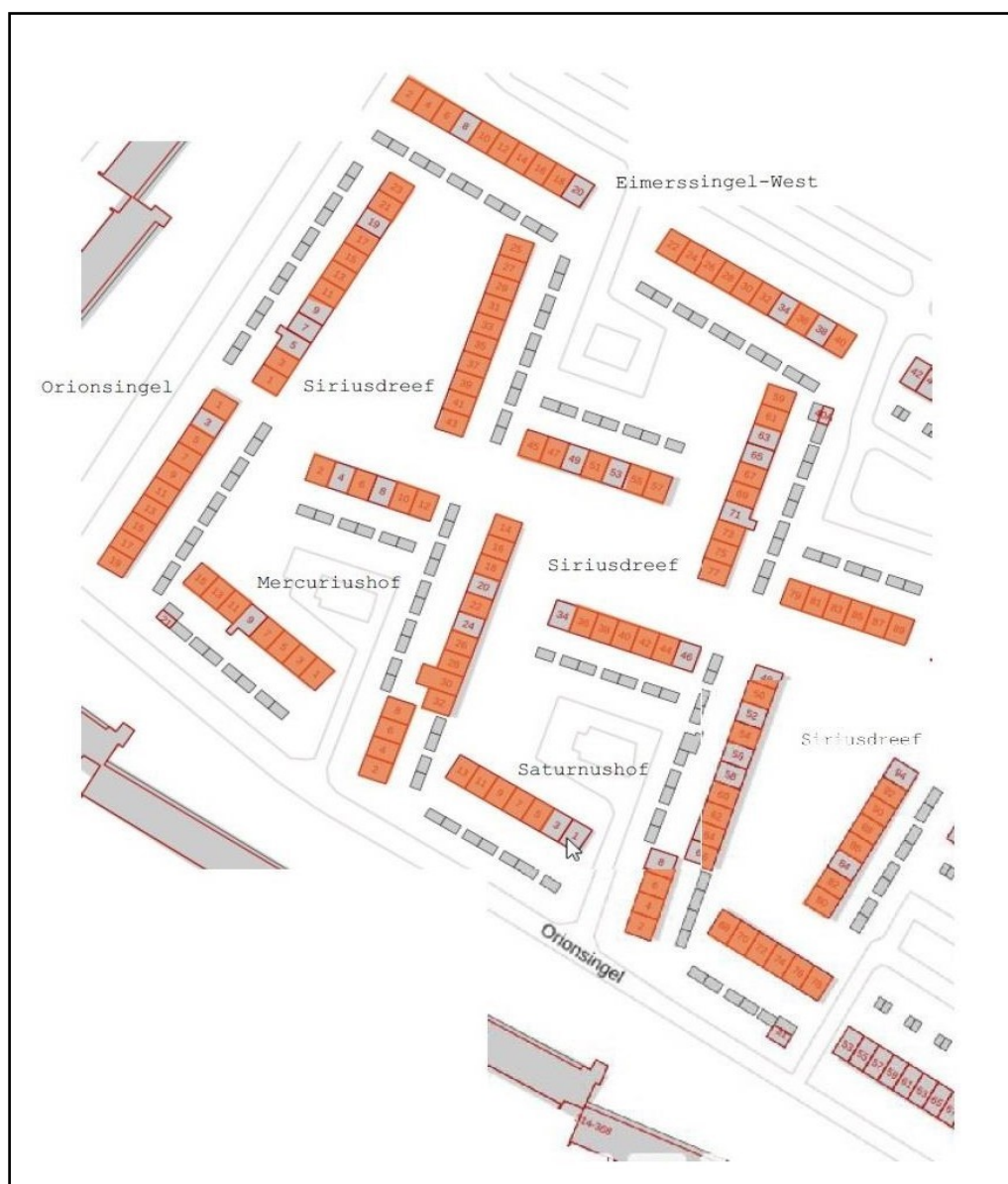
Figuur 2: Overzicht van het plangebied Siriusdreef, in de vorm van roodgekleurde blokken. De grijsgekleurde woningen zijn in particulier bezit.