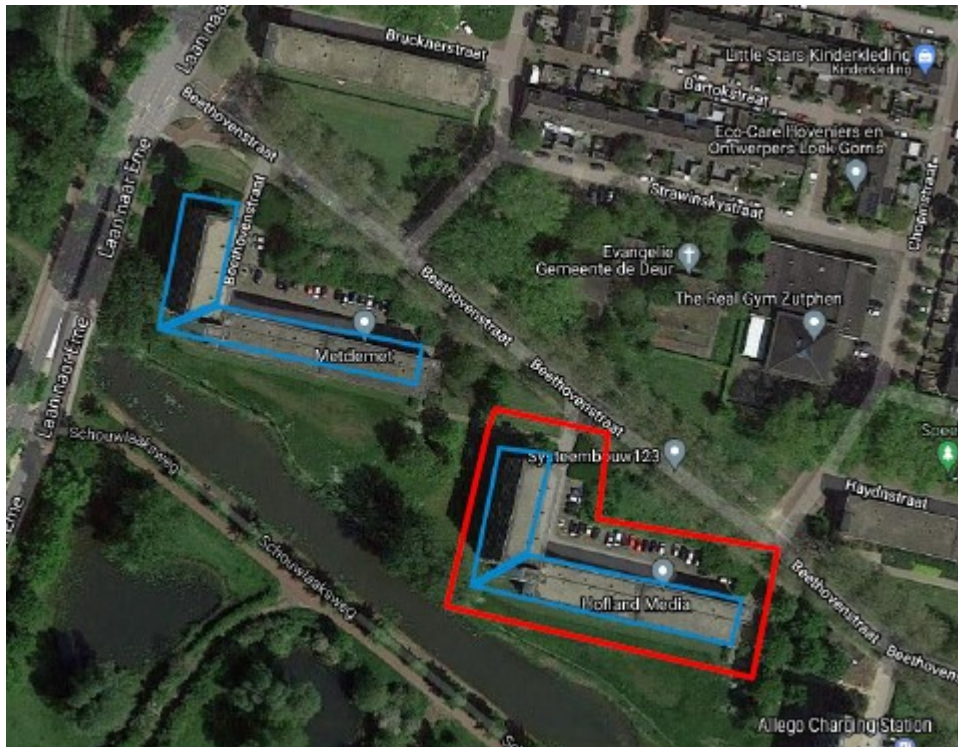
Figuur 1: Plangebied complex 280-02 aan de Beethovenstraat 130-256 te Zutphen (rood omlijnd).