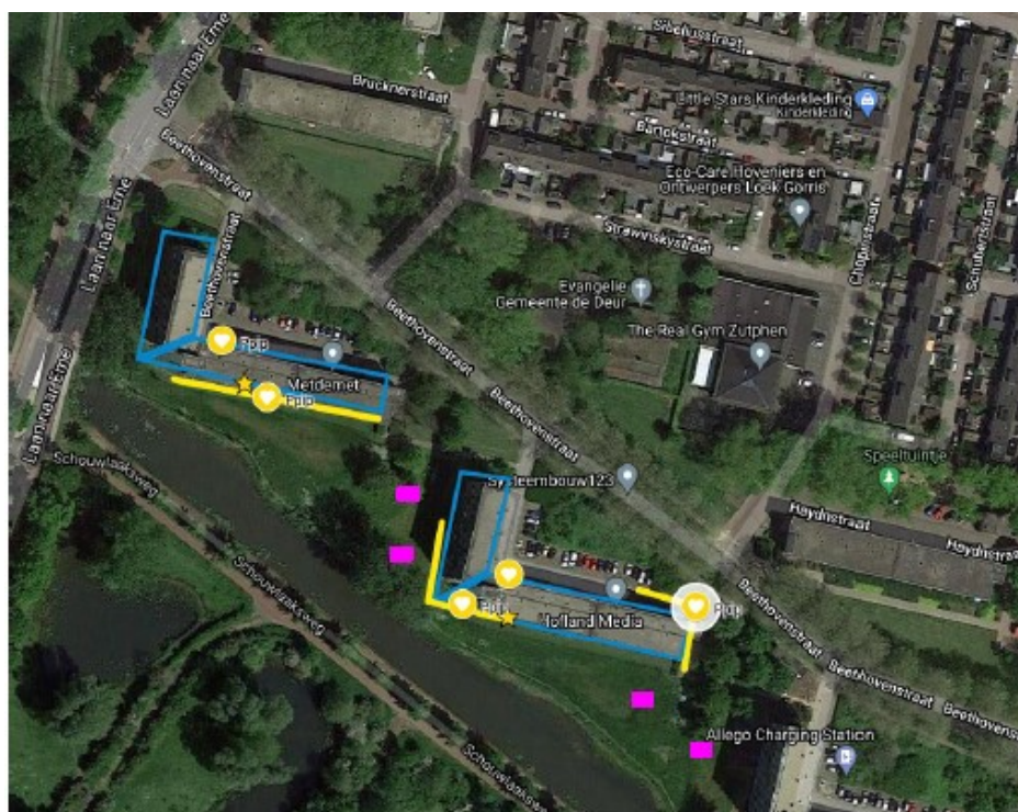
Figuur 1: Locatie 4 paaltopkasten T3 voor de gewone dwergvleermuis (paarse rechthoeken)