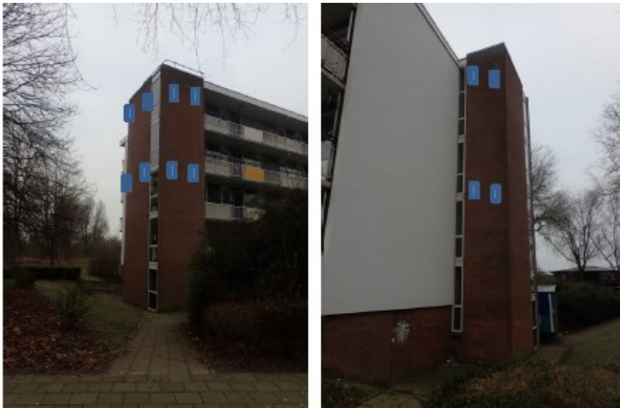
Figuur 3: Bij benadering locaties permanente inmetselfkasten gewone dwergvleermuis in trapportaal.