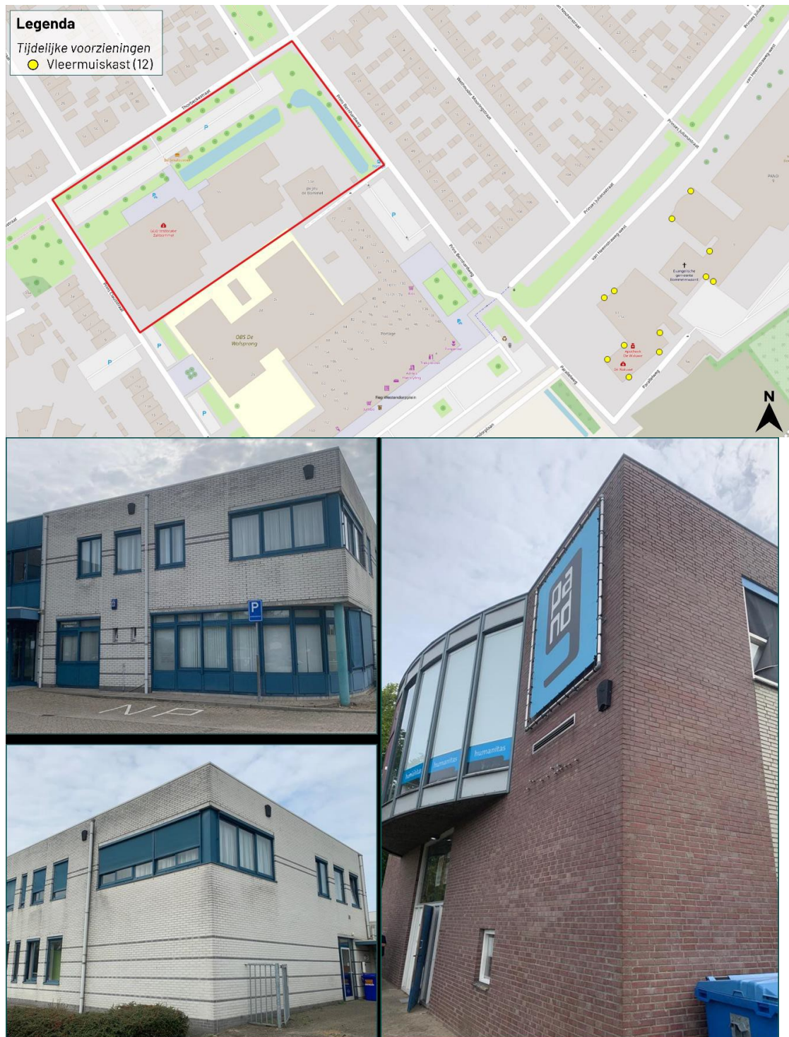
Figuur 2: Locatie tijdelijke vleermuiskasten (Blom ecologie, 2022).