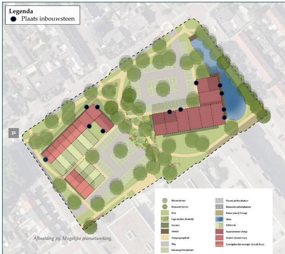
Figuur 3: Locaties permanente voorzieningen (Blom ecologie, 2022).